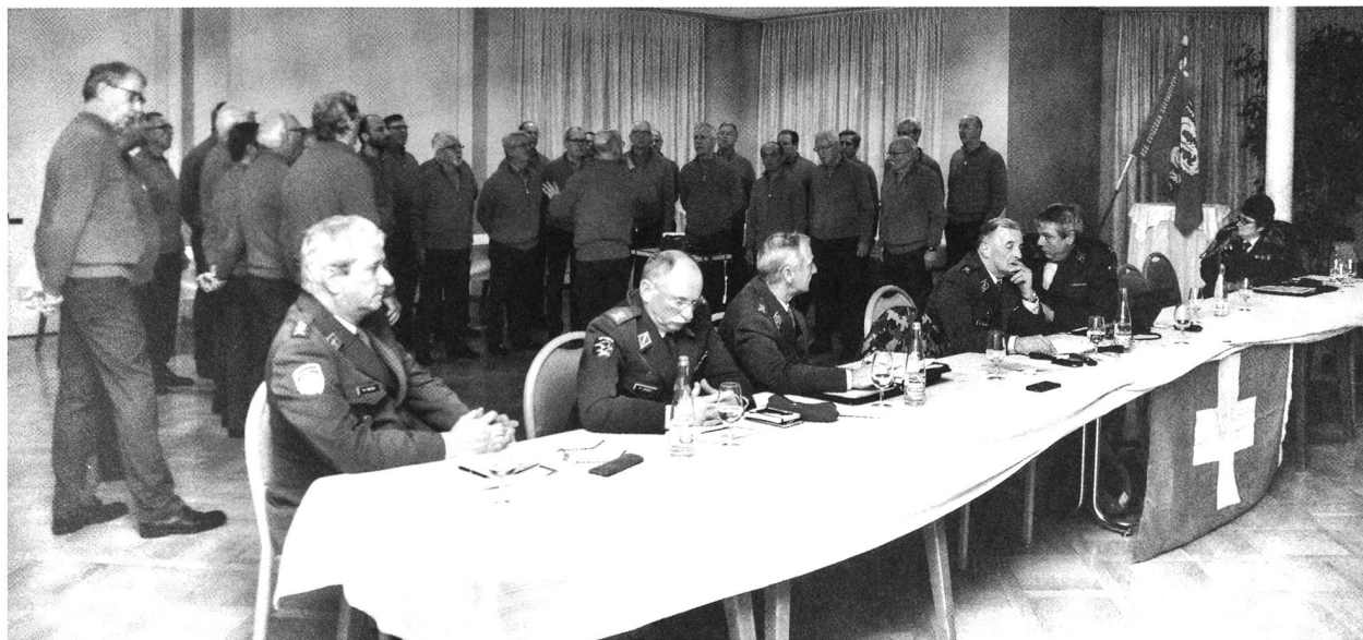
I Cantori delle Cime ed il Comitato