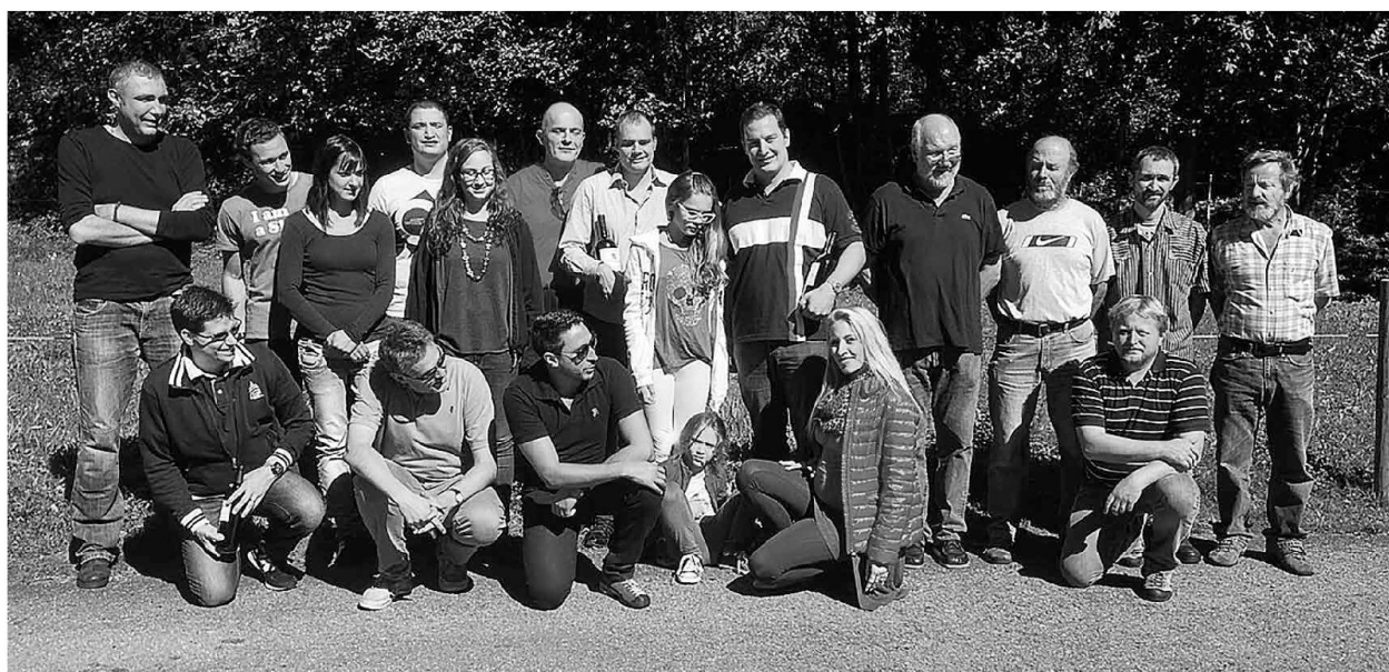
Foto di gruppo