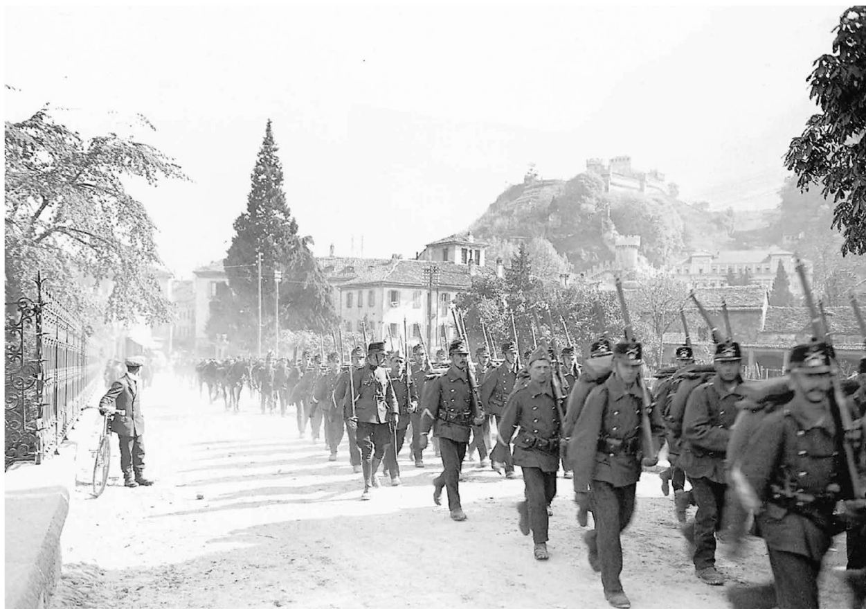
La fanteria di montagna sfila nelle strade di Bellinzona.

Il suo successore, Comandante Morier, annuncia il 19.10.1908: