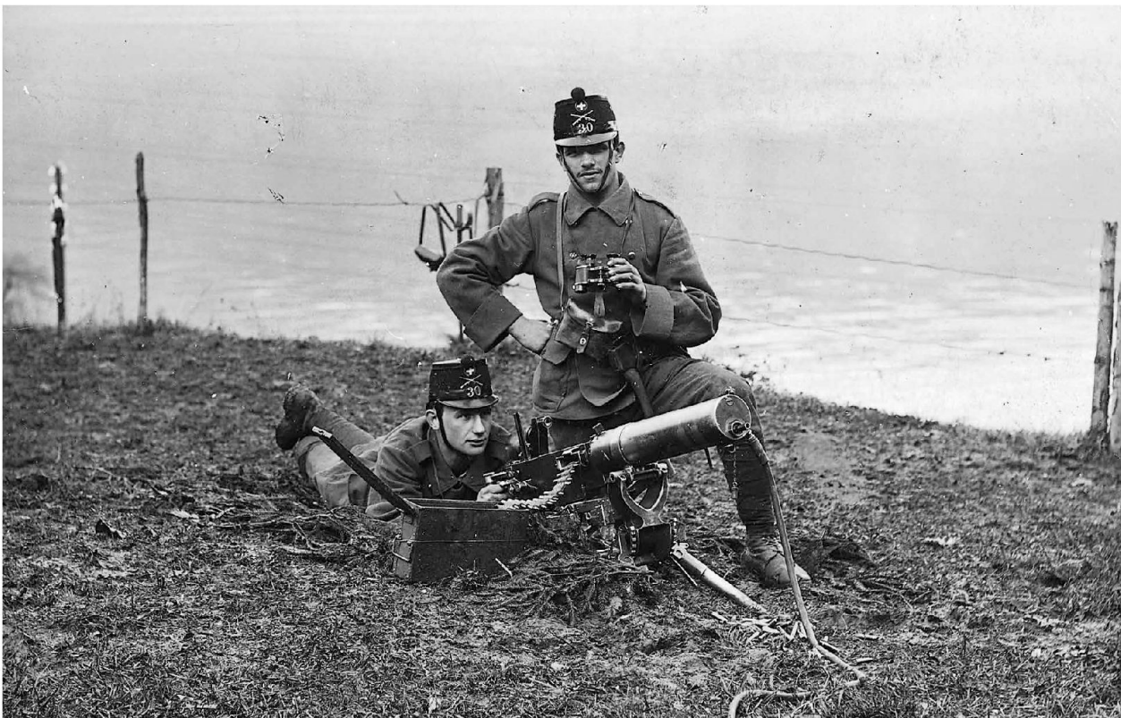
In ginocchio il nonno materno e in copertina, 2. da sinistra prima fila, il nonno paterno del red. resp. RMSI