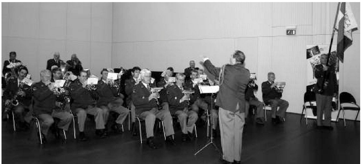
La Musica militare ticinese ha condecorato la cerimonia, inframmezzando ai momenti ufficiali note musicali particolarmente apprezzate.

Vi ringrazio per la vostra attenzione e specialmente per la vostra disponibilità di servire nell'Esercito svizzero. Grazie.