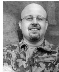
Cap Federico Nizzola

Durante l'età del ferro la popolazione italica si è incrementata e molti villaggi sorgono, a cominciare dal X-IX secolo a.C., lungo il corso del Tevere e sui Colli Albani nei pressi della costa. Il territorio è abitato dai Latini e da altre popolazioni, come per esempio i Sabini. Vuole la tradizione, oggi in parte provata da ritrovamenti archeologici, che Roma fu fondata nel 753 a.C. sul colle Palatino, uno dei rilievi della riva sinistra del Tevere in prossimità del guado dell'Isola Tiberina. Questo villaggio era posto all'incrocio di due fondamentali vie di comunicazione: quella del sale, che dal Tirreno risale il Tevere verso l'interno, e quella che unisce