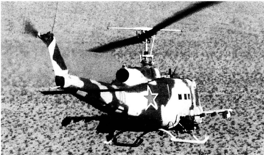
Elicottero UH 1 statunitense camuffato da «Hind D» sovietico.