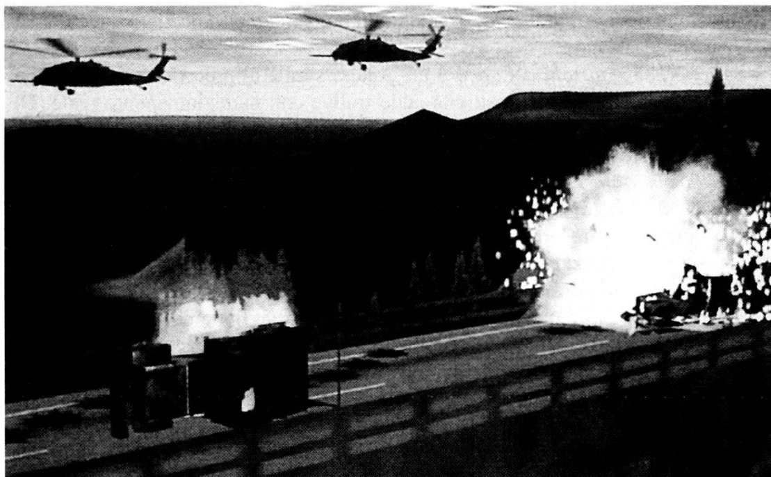
Nella foto: esempio di simulazione virtuale applicata a concreti scenari operativi.