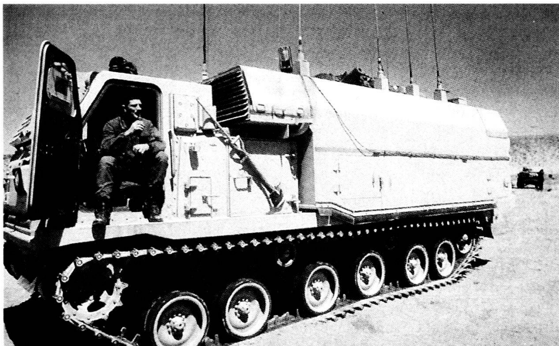
Nella foto qui sopra: cingolato adibito a Posto Comando di una Grande Unità corazzata.