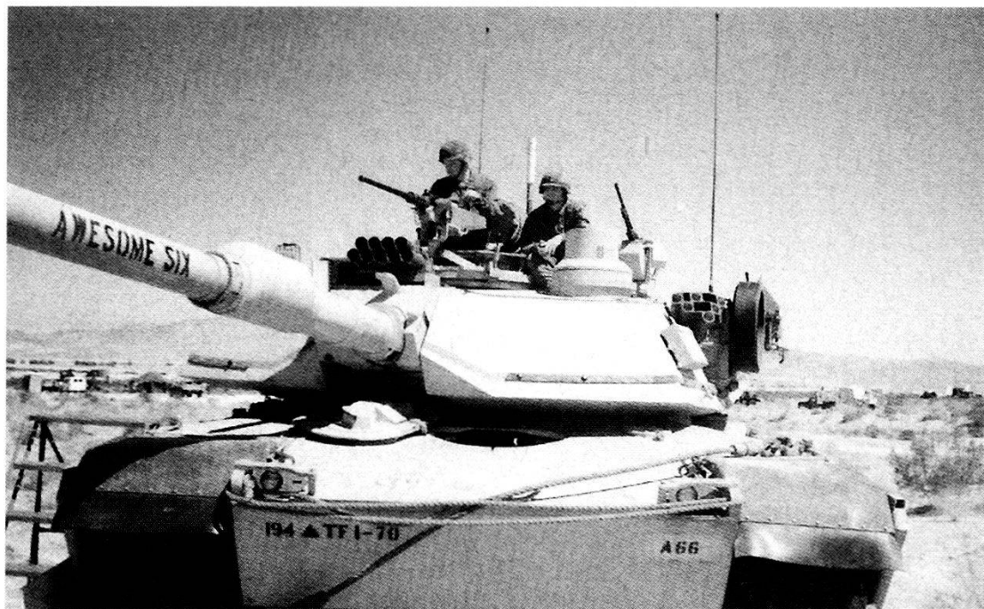
Carro leggero M 551 «Sheridan» utilizzato per simulare un carro armato avversario.

Sempre in tale ottica il partito contrapposto impiega su base permanente anche compagnie di altri Eserciti quali il Reggimento inglese «Scottish Highlander», il Reggimento canadese «Princess Patricia» ed Unità del Corpo dei Marines inviate a rotazione presso il Centro. Questo sistema di «rinforzi» consente quindi di non costituire in permanenza una Grande Unità per lo scopo ma di disporre quando