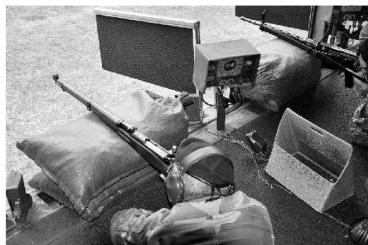
Un momento della prova del tiro sorpresa con il Fucile Schmid Rubin K31 e il Fucile assalto 57 allo stand 300m.