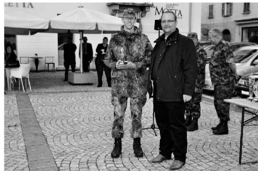
Il Consigliere di Stato Norman Gobbi, premia un concorrente dell'esercito tedesco.