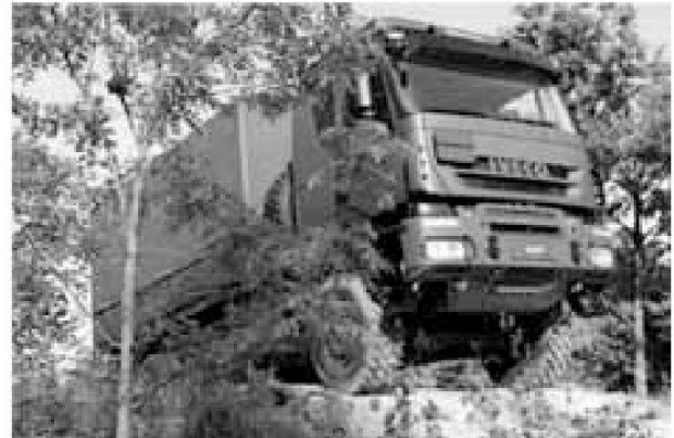
Esempio: autocarro fuoristrada IVECO 4x4

disponibilità dei mezzi l'esercito abbisogna di nuovi autocarri: essi devono essere dotati di un sistema di carico e scarico di contenitori intercambiabili. Tale sistema consente di caricare e scaricare autonomamente contenitori scarrellabili o intercambiabili e container ISO.