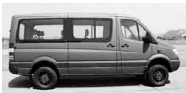
Mercedes-Benz Sprinter, versione 316D, 4x4, per il trasporto di persone

Un'assegnazione capillare alla truppa dei nuovi furgoni non sarà possibile. Pertanto essi saranno consegnati in funzione delle necessità momentanee della truppa.