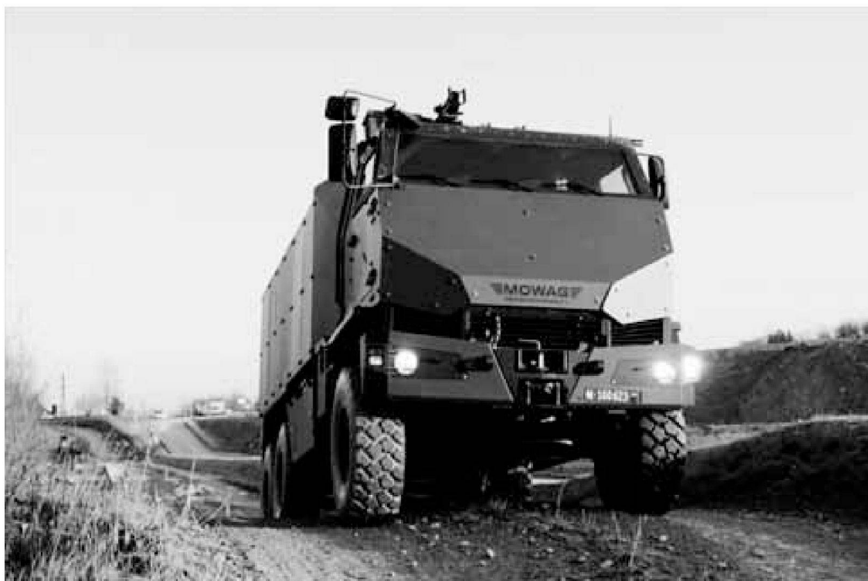
Il veicolo trasporto truppa protetto (VTTP), DURO IIIIP, 6x6

La fanteria svolge un ruolo centrale nelle operazioni militari. L'ampia gamma delle opzioni operative e dei rischi a cui è esposto il singolo soldato rende necessario un veicolo con un elevato livello di protezione. Tuttavia dei 20 battaglioni di fanteria, previsti dalla fase di sviluppo dell'esercito 2008 - 2011, soltanto quattro sono equipaggiati completamente con il carro armato granatieri 93 ruotato (Piranha).