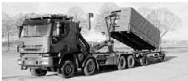
Esempio: camion 8x8 e contenitore intercambiabile su rimorchio con dispositivo a slitta

Per raggiungere l'auspicata polivalenza, grazie anche all'utilizzo di un numero sempre crescente di contenitori scarellabili e amovibili, è necessario dotarsi di rimorchi supplementari, con o senza il dispositivo a slitta.