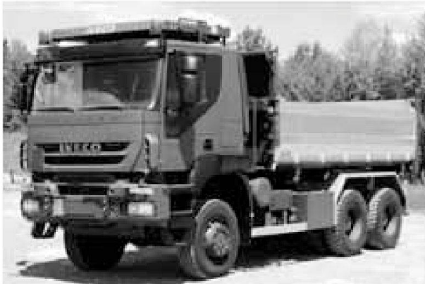
Esempio: autocarro IVECO 6x6 con ponte ribaltabile su tre lati