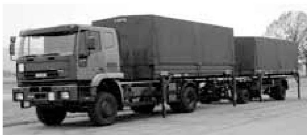
Esempio: camion 4x4 con rimorchio e contenitori intercambiabili

Un'assegnazione capillare alla truppa dei rimorchi per contenitori intercambiabili (con o senza il dispositivo a slitta) non sarà però possibile. Le consegne avverranno quindi secondo le necessità momentanee della truppa. La manutenzione sarà eseguita nelle infrastrutture esistenti dei centri logistici dell'esercito. I rimorchi per contenitori intercambiabili fanno parte di una famiglia di rimorchi a due assi con ammortizzatori pneumatici. Essa comprende pure i 277 rimorchi già acquistati (e introdotti nell'esercito) nell'ambito dei Programmi d'armamento 1999 e 2002.