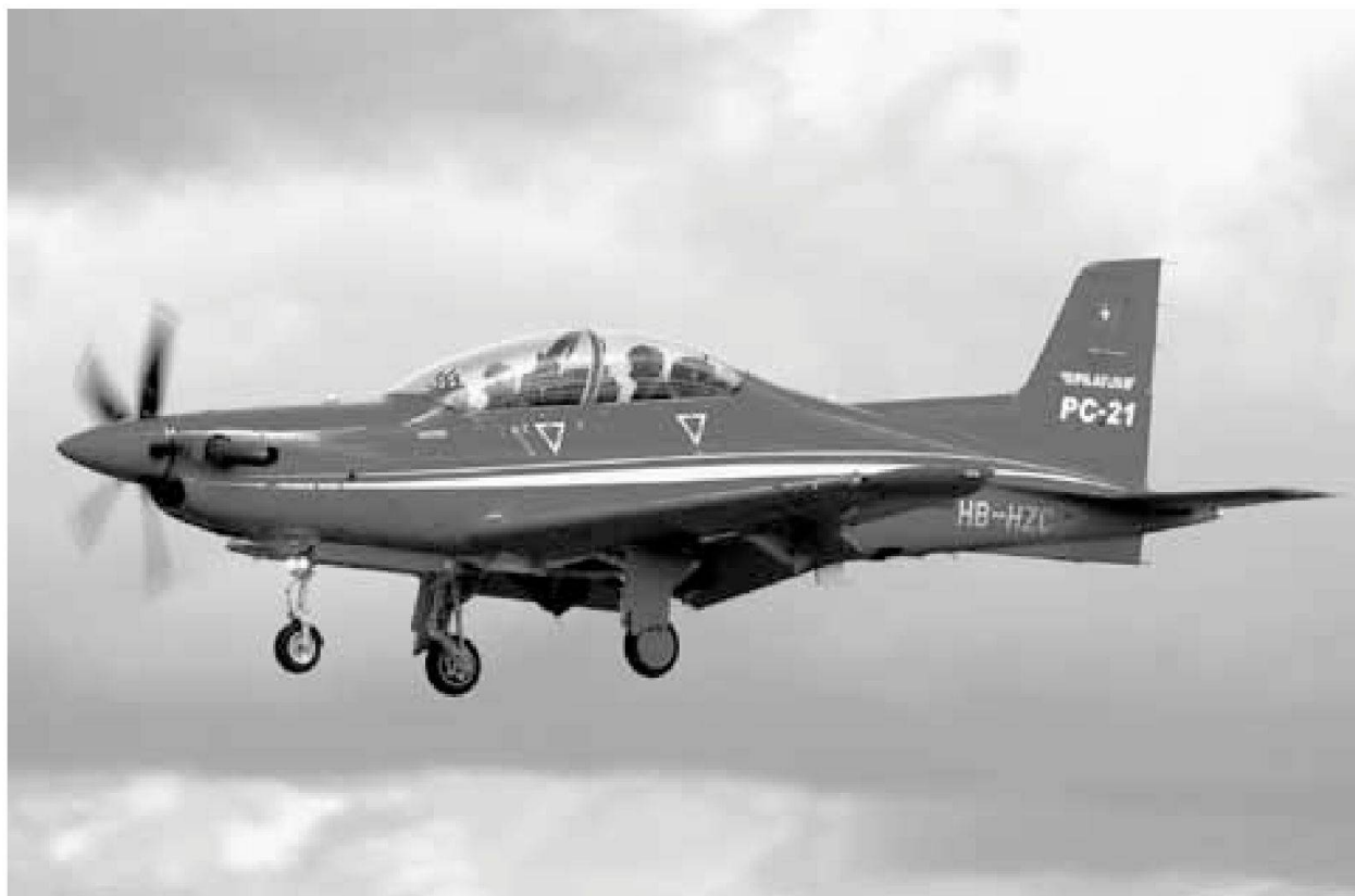
Il velivolo PC-21 della Pilatus Flugzeugwerke AG

Il sistema d'istruzione dei piloti di jet PC-21 (l'abbreviazione JEPAS PC-21 significa Jet piloten- A usbildungssystem PC-21), comprendente il velivolo d'addestramento PC-21 e il relativo sistema d'istruzione terrestre, costituisce lo strumento principale d'istruzione dei futuri piloti d'avioggetti.