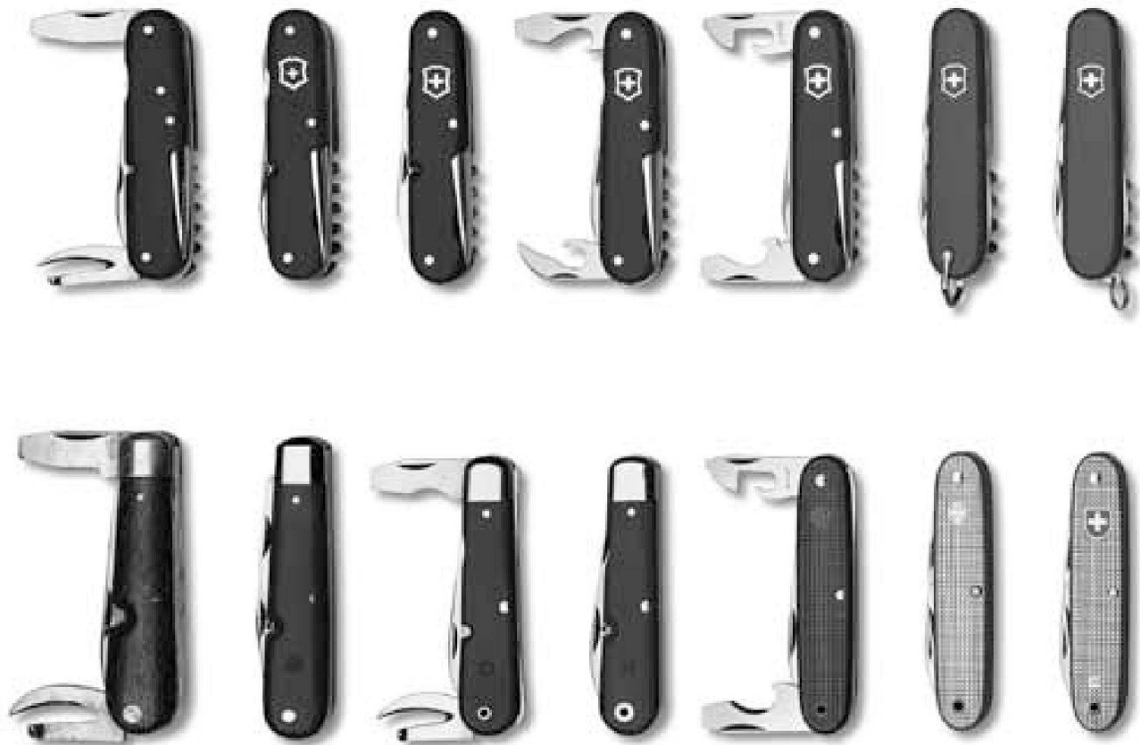
L'evoluzione del coltellino svizzero in versione civile (sopra) e militare (sotto).

croce svizzera appare senza scudetto rosso e il timbro di accettazione, come quello del 1951, è apposto sulla croce svizzera.