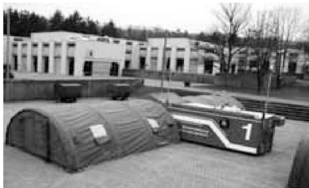
CONTIN 1 per la condotta nell'impiego. Il sistema comprende mezzi per la condotta e la comunicazione molto moderni.

I militari imparano ad usare una parte di questi mezzi già durante la scuola reclute. Tuttavia, in considerazione del fatto che il comando dispone di una dotazione di materiale più ampia di quella della scuola reclute, i militari in ferma continuata devono necessariamente seguire un'istruzione supplementare.