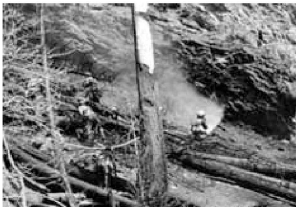
Incendio boschivo a Visp (2011).

Sinistra: posa della condotta principale di una lunghezza di 2 Km con 3 bacini di 50m 3 per il pescaggio dell'acqua degli elicotteri.