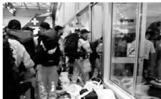
Militi della fo interv acc alla base della REGA all'aeroporto di Zurigo mentre si preparano per l'impiego con la Catena svizzera di salvataggio a Sumatra (2009)