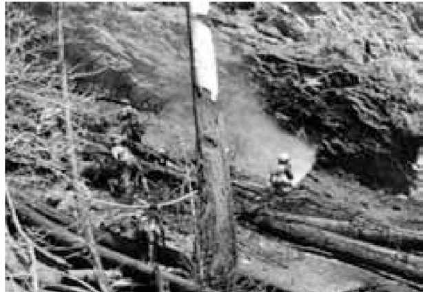
Incendio boschivo a Visp (2011).

Sinistra: posa della condotta principale di una lunghezza di 2 Km con 3 bacini di 50m 3 per il pescaggio dell'acqua degli elicotteri.