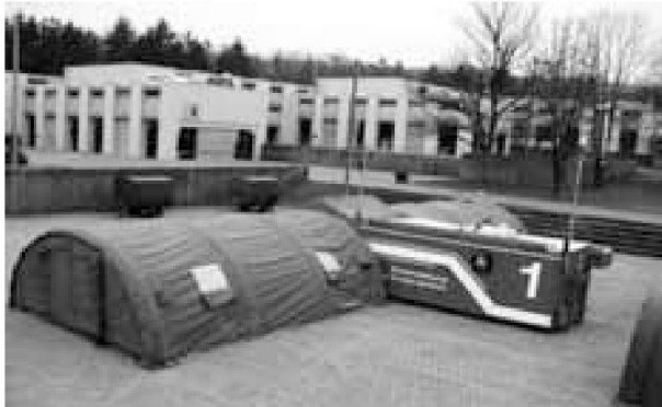
CONTIN 1 per la condotta nell'impiego. Il sistema comprende mezzi per la condotta e la comunicazione molto moderni.

I militari imparano ad usare una parte di questi mezzi già durante la scuola reclute. Tuttavia, in considerazione del fatto che il comando dispone di una dotazione di materiale più ampia di quella della scuola reclute, i militari in ferma continuata devono necessariamente seguire un'istruzione supplementare.