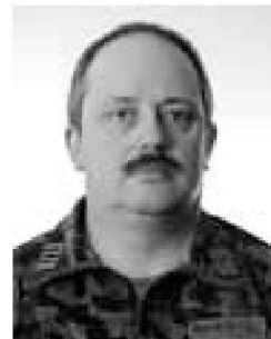
Colonnello Moreno Monticelli

TESTO E FOTO COLONNELLO MORENO MONTICELLI, COMANDANTE DELLA FORMAZIONE D'INTERVENTO D'AUIO IN CASO DI CATASTROFE