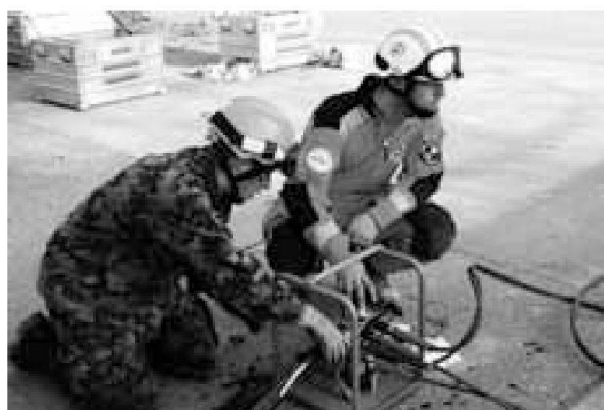
L'istruzione di base dei membri esterni della Catena di salvataggio Sviz a cc presso il nostro cdo.

Oltre ad assicurare l'aiuto militare in caso di catastrofe in Svizzera, il Cdo fo interv acc svolge anche impieghi di aiuto in caso di catastrofe all'estero.