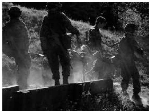
Istruzione, percorso sanitario