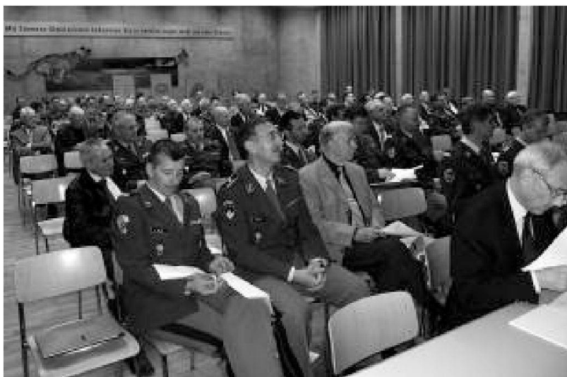
Sala con partecipanti ed ospiti durante l'Assemblea generale ordinaria della Società Uff SMG, nella giornata «Spirito di corpo» a Lucerna.

L'assemblea si è pronunciata a favore di queste idee. In particolare, il Consigliere di Stato Josef Dittli, direttore della sicurezza del cantone di Uri e lui stesso ufficiale SMG, ha sottolineato l'importanza di occuparsi della continua