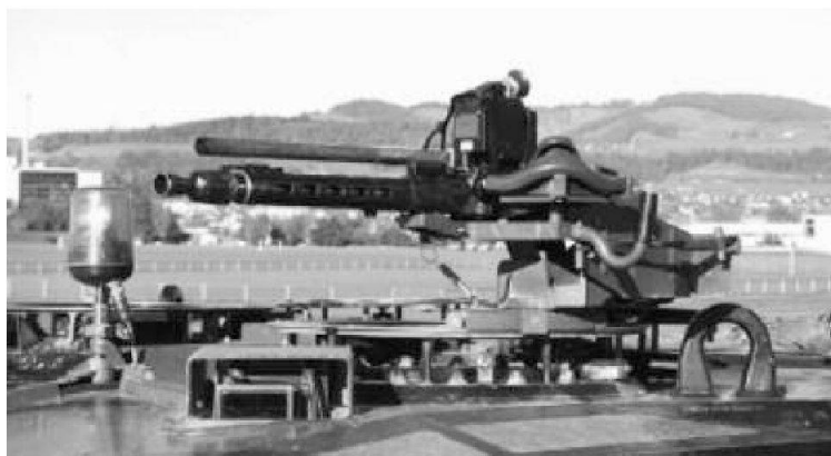
Mitragliatrice della torretta e dispositivo di mira

Il simulatore di tiro a raggi laser attualmente impiegato non soddisfa più i requisiti militari e tecnici, è obsoleto, ed è inoltre limitato all'arma principale (cannone calibro 120 mm). Il nuovo simulatore LASSIM Leo integra per contro anche le armi secondarie, vale a dire la mitragliatrice coassiale e quella della torretta. Nuovo è pure il fatto che il LASSIM Leo trasmette ad una centrale di comando la posizione sul terreno del mezzo, i dati relativi ai danni causati dalle armi. Ciò consente una sorveglianza ed un addestramento più efficienti dell'equipaggio, sia nel combattimento sul terreno aperto come pure in zone urbane. Il LASSIM Leo sarà impiegato per l'istruzione di base e al combattimento. Nel primo caso i militi potranno esercitarsi autonomamente alla manipolazione e all'impiego delle armi: nel secondo tutto l'equipaggio si eserciterà al combattimento (in duello) con una controparte pure equipaggiata con simulatori di tiro.