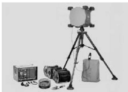
Sistema a fasci hertziani R-905

Sotto la voce “potenziamento delle infrastrutture di telecomunicazioni” si cela in verità l'acquisto di 5 sistemi diversi per le telecomunicazioni, alcuni dei quali avrà il compito d'assicurare l'effettiva operatività del precedente progetto SIC FT. I nuovi mezzi sono in gran parte uguali, o molto simili, a quelle acquisiti negli anni precedenti ed impiegati regolarmente dalla truppa. Si tratta quindi d'acquisizioni successive e di un ampliamento dell'impiego con sistemi già oggi operativi.