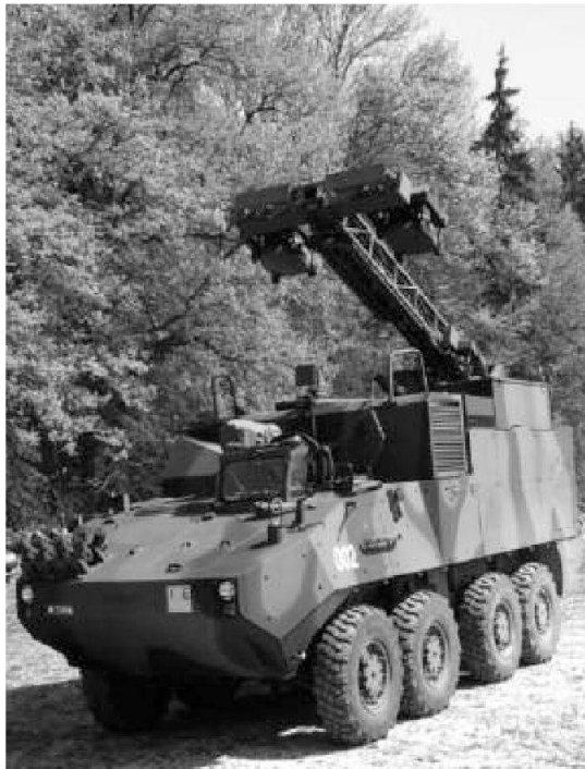
Veicolo per le comunicazioni Piranha IIC

Il Piranha IIC 8x8 è quasi identico al veicolo blindato ruotato IMP acquistato con il PA 2002.