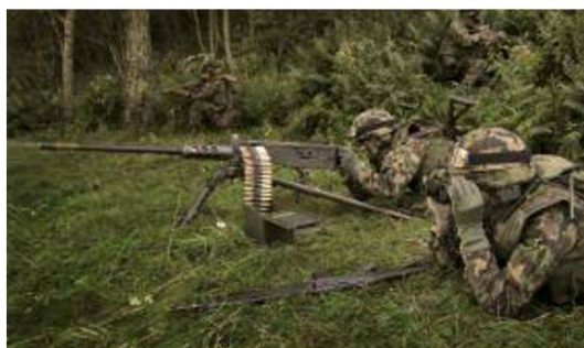
Granatieri specializzati alla mitragliatrice 12,7mm 64.