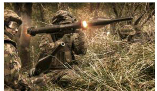
Specialisti PzF in azione.