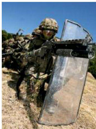
Équipe munita di scudo protettivo si prepara ad un'entrata dinamica in un edificio.

La terza operazione, nome di copertura "HAMMER", si svolge nell'ambito di operazioni di difesa sulla pz d'Armi di St. Lutzisteig presso il villaggio per il combattimento di località.