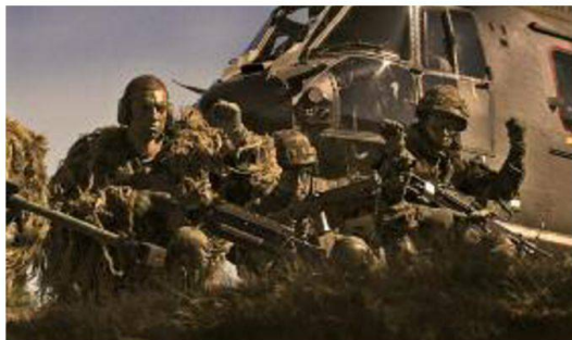
Granatieri sbarcati da un elicottero SP Cougar si apprestano ad entrare in azione.

Dopo aver eseguito, durante due settimane, una formazione di base in qualità di esploratore/organo di comando per il futuro tiratore scelto granatiere la formazione dura 9 settimane e le prime 4 sono caratterizzate dall'istruzione di base comprendente l'insegnamento teorico e pratico al fucile tiratori scelti 04 in calibro 8,6mm. Le reclute, inoltre, approfondiscono le conoscenze relative alla lettura carte, al camuffamento, al bivacco in montagna e alla costruzione di un posto d'osservazione. La quinta settimana è caratterizzata da tiri a lunga distanza in calibro 8,6mm sulla pz d'armi di Hinterrhein. Nella sesta settimana durante un esercizio d'impiego di tre giorni il candidato tiratore scelto metterà in pratica quanto appreso nella prima fase di formazione. Le successive tre settimane sono dedicate unicamente all'istruzione al fucile di precisione 04 in calibro 12,7mm. Ogni granatiere tiratore scelto, durante questo periodo d'istruzione, effettuerà circa 400 tiri con il fucile tiratori scelti 04 in calibro 8,6mm e 200 con il fucile di precisione 04 in 12,7mm.