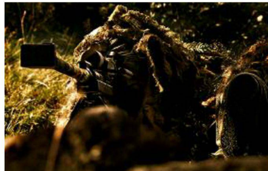
Team di tiratori scelti in posizione con il fucile di precisione 04.