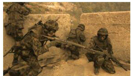
Fase d'istruzione al cdt di località.

Nell'IDR, della durata di 8 settimane, vengono applicate e messe in pratica le conoscenze apprese con lo svolgimento di differenti esercizi d'impiego tra i quali gli esercizi finali "FALCONE", "TORCHE" e "HAMMER". Durante questa fase di istruzione alle reclute granatieri vengono affiancati i quadri di milizia in servizio pratico, così da formare un'unità d'impiego completa.