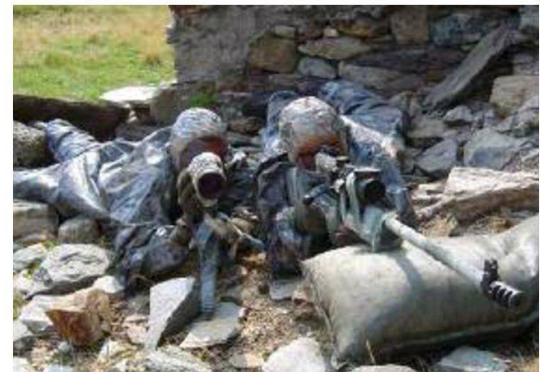
Team di tiratori scelti in posizione con il fucile tiratori scelti 04.

Lo stage si svolge completamente all'aperto. La giornata è dedicata a svariate istruzioni tecniche e durante la notte i