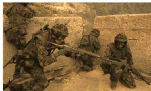
Fase d'istruzione al cdt di località.

Nell'IDR, della durata di 8 settimane, vengono applicate e messe in pratica le conoscenze apprese con lo svolgimento di differenti esercizi d'impiego tra i quali gli esercizi finali "FALCONE", "TORCHE" e "HAMMER". Durante questa fase di istruzione alle reclute granatieri vengono affiancati i quadri di milizia in servizio pratico, così da formare un'unità d'impiego completa.