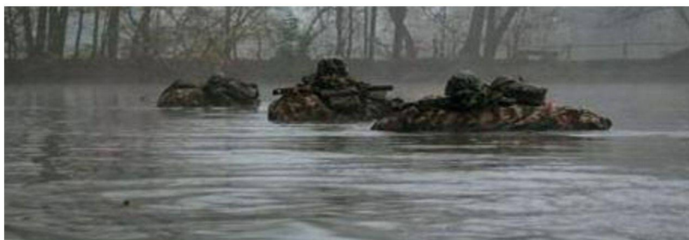
Una pattuglia del corso "sopravvivenza nel terreno" supera un ostacolo acqueo con tutto l'equipaggiamento personale.

4 Laser Target Designation traducibile con "guida terminale di munizionamento"