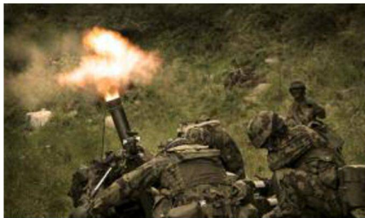
Durante la scuola ufficiali i futuri capi sezione apprendono le tecniche d'impiego di tutte le armi del bat granatieri. In questo caso il lm 8,1cm.

Prima dell'avvento di Esercito XXI ai granatieri mancava una capacità "tiratori scelti" a lunga distanza. Questa lacuna è stata colmata con la messa in atto di un ambizioso programma di formazione e di equipaggiamento. La formazione si suddivide in due corsi ben distinti, il primo dedicato a tutti i tiratori scelti delle Forze Terrestri (6 settimane) e il secondo indirizzato specificatamente ai granatieri e con la specializzazione al tiro a lunga distanza.