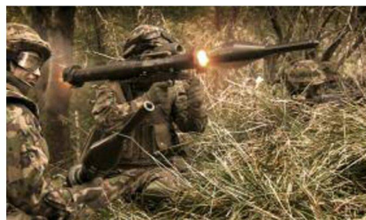
Specialisti PzF in azione.