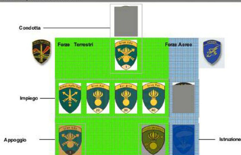
Le varie componenti delle FREG.