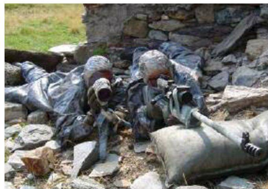
Team di tiratori scelti in posizione con il fucile tiratori scelti 04.

Lo stage si svolge completamente all'aperto. La giornata è dedicata a svariate istruzioni tecniche e durante la notte i