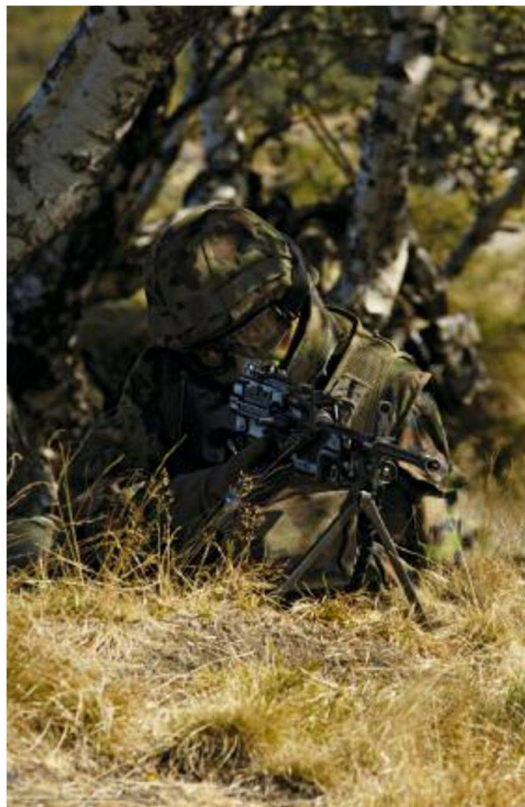
Con l'introduzione della mitr leggera 05 la potenza di fuoco a livello gruppo/sezione è aumentata di molto.

In seguito rientrerà alle scuole granatieri e svolgerà la scuola ufficiali di 18 settimane. Questa scuola è suddivisa in blocchi modulari che comprendono in generale: