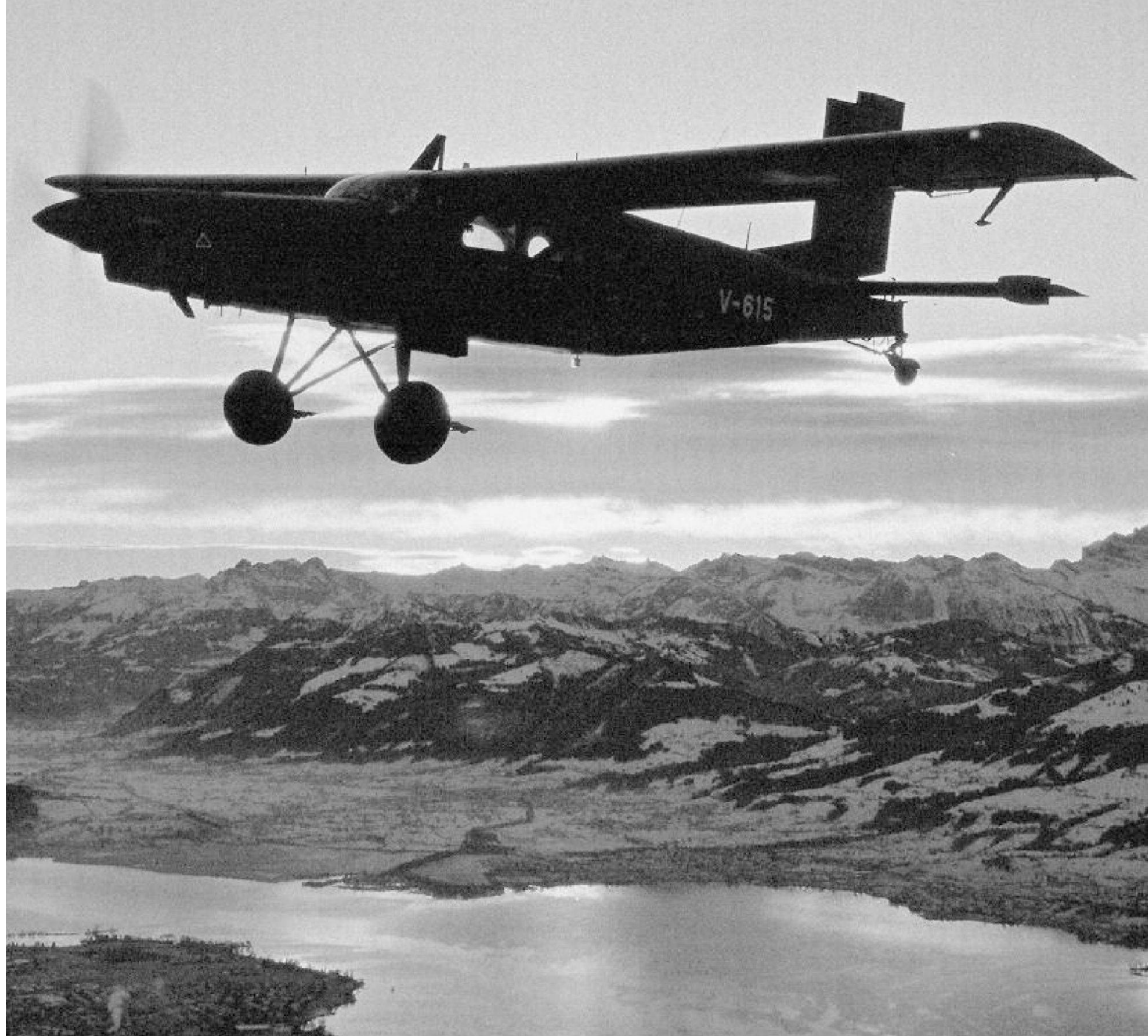
Sopra: PC-6 in volo serale sopra il lago di Zurigo. Nella pagina successiva: regolazione di un iniettore di carburante.

Pluriennale è sicuramente riduttivo in quanto la sua attività iniziò nel corso dell'ultimo conflitto mondiale, quindi ben 60 anni fa.