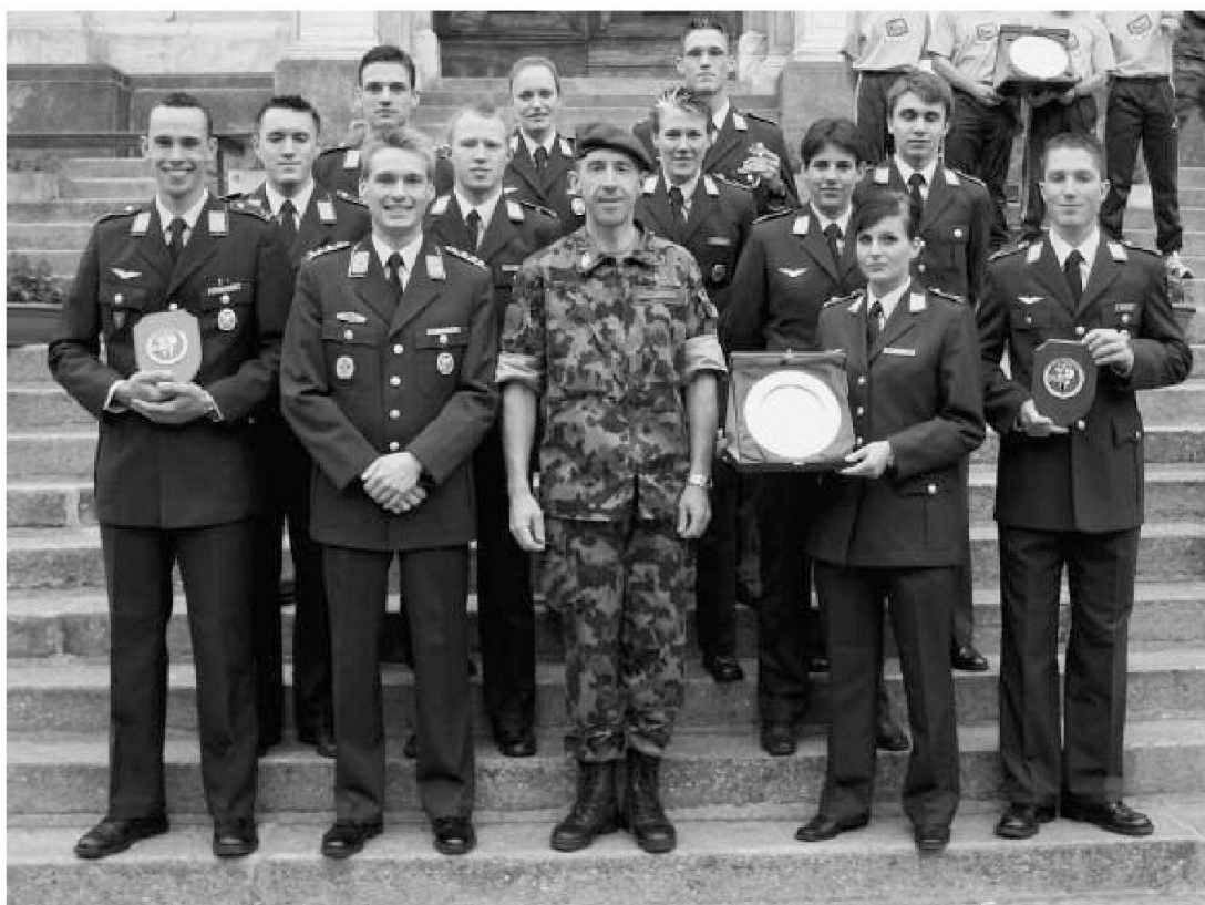
Pattuglie della scuola ufficiali delle Forze Aeree della Bundeswehr alla premiazione

Quest'anno la gara avrà un aspetto internazionale vista la partecipazione di pattuglie della scuola ufficiali delle Forze Aeree della Bundeswehr nonché quelle dei paracadutisti di Monza e dell'UNUCI (Unione nazionale degli ufficiali in congedo italiani) di Trento. ■