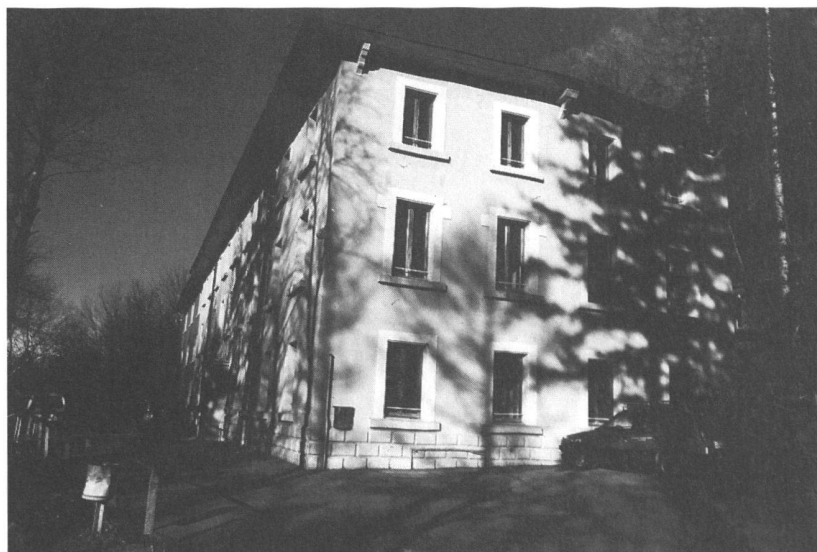
La caserma di St. Maurice