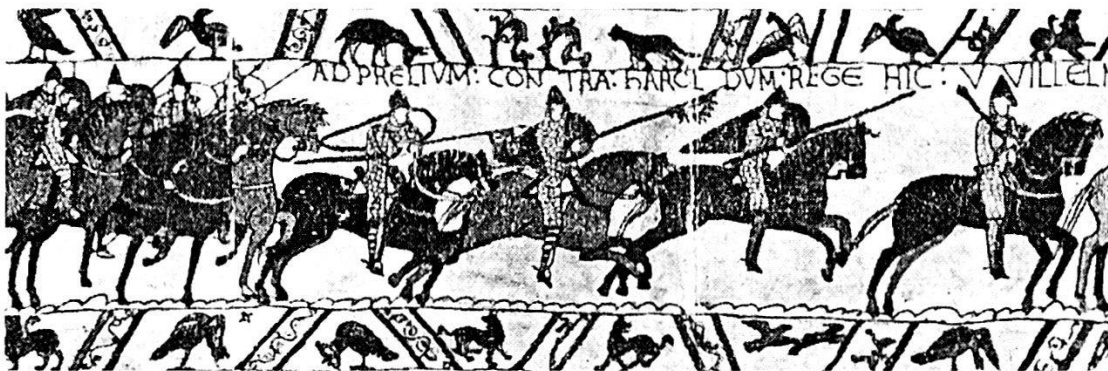
Cavalieri che partono all'attacco.

L'ambiente favorevole per il loro propagarsi fu creato essenzialmente dalle discordie intestine nelle quali degenerò la vita dei feudi e dei comuni. Quando le fazioni avverse si disputarono il potere e dei dissensi approfittarono i più audaci per impossessarsene, per cercare di abbattere l'autorità del comune e fondare sulle sue rovine la signoria di una famiglia, le milizie comunali, in quanto s'identificavano con i cittadini, parteciparono anch'esse alle lotte interne e si divisero tra le fazioni in lotta, ciascuna delle quali per sopraffare l'altra ricorse anche abbondantemente all'aiuto di venturieri mercenari. L'apporto delle compagnie di ventura rappresentò un elemento prezioso di preponderanza, soprattutto per la loro superiorità nell'addestramento e per la brutalità militaresca con la quale esse si resero temibili. Giova notare che le milizie mercenarie ebbero prevalente funzione regia in contrasto con le milizie feudali.