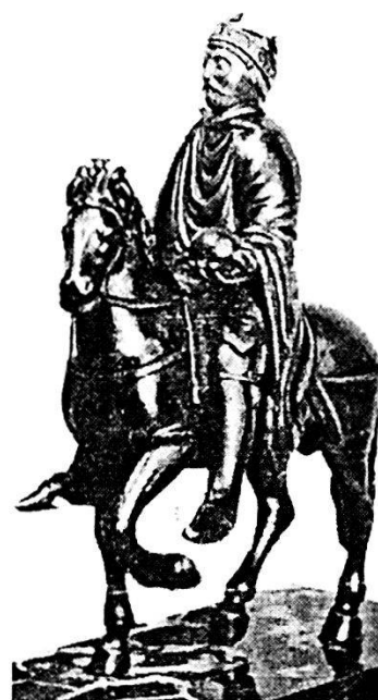
Statuetta in bronzo rappresentante l'imperatore Carlo Magno (Museo Carnavalet).

Non tutti i particolari della costituzione degli eserciti carolingi sono giunti sino a noi. Si sa che essi si fondarono sul principio del servizio obbligatorio e gratuito per tutti i detentori di benefici imperiali ed i loro clienti, cioè per coloro che secondo il diritto romano, sono persone, dipendenti, vassalli in rapporto di dipendenza rispetto a colui che deve proteggerli. Tutti gli uomini liberi possessori di una certa area di terreno, almeno sei ettari, avevano anche loro l'obbligo di servire personalmente nell'esercito; i proprietari minori si riunivano nel numero necessario per giustificare la proprietà di un numero di sei ettari: uno di essi prestava effettivamente servizio militare, gli altri fornivano le armi, i cavalli, le provvigioni. Per i vincolati al feudo si doveva obbedienza agli ordini di coscrizione: tale beneficio di appartenenza andava perduto in caso di renitenza o diserzione; per i liberi proprietari invece le sanzioni erano meno facili ed il mancato concorso ai bandi di reclutamento fu più frequente. Le chiamate sotto le armi raramente erano generali e frequentemente si limitarono alle provincie e regioni più vicine al teatro delle operazioni. Il sistema militare, ancora in generale male coordinato di Carlo Magno, riportò i successi che noi tutti ricordiamo essenzialmente grazie al prestigio del grande imperatore e fu questa la ragione per cui alla fin fine non gli sopravvisse. Diminuita la forza dell'autorità imperiale, la