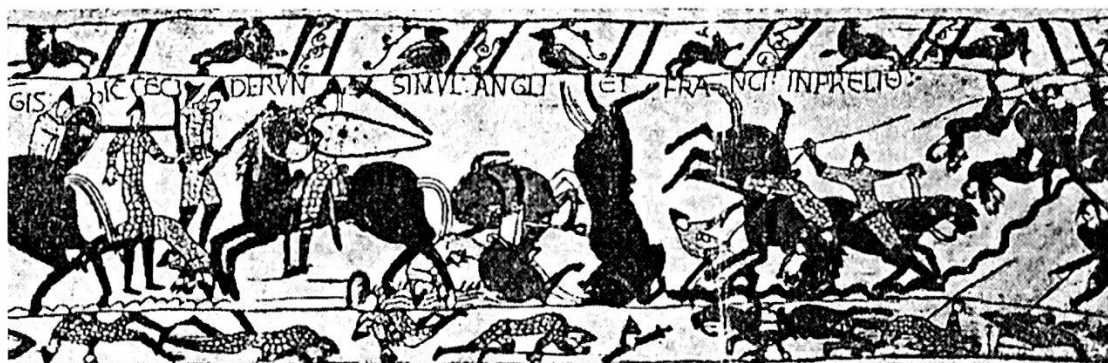
Cavalieri contro fanterie (Arazzi di Bayeux).

Con l'utilità che il mestiere delle armi procurava crebbe il numero di coloro che volevano dedicarvisi. Sovente inoltre si riunirono numerose compagnie di ventura, previ accordi tra i loro capi, a costituire degli eserciti, per quei tempi, di notevole mole, decine di migliaia di uomini, fanti e cavalieri con ausiliari per le retrovie e l'approvvigionamento. Questi complessi armati adottarono, ad esempio in Italia, metodi di combattimento con schieramenti su più linee, con riserve e servizi di esplorazione e collegamento. Rimaneva però assai difettosa la base etica di tali armate di ventura le quali non furono evidentemente guidate da una finalità superiore e che si volsero quasi sempre laddove poteva essere maggiormente pingue il bottino e più generoso il soldo.