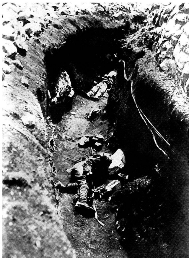
Effetto dei gas asfissianti sul San Michele (29.6.1916).

cati di yperite sulle truppe franco-inglesi. Sul fronte italiano il primo attacco a gas venne compiuto dagli austriaci con 3000 bombole il 29 giugno sul San Michele: 8000 uomini, di cui 5000 perirono, furono messi fuori combattimento. Anche gli inglesi si servirono dell'arma chimica e ne impiegarono poco meno di 90.000 bombole. Complessivamente durante tutto il conflitto si ebbero da entrambi le parti dei belligeranti 400 attacchi con gas asfissianti. La guerra prese fine, ma ciò malgrado le riserve di aggressivi chimici accumulate nel corso del conflitto non scomparvero. La conferenza riunitasi a Ginevra nel 1925 sotto l'egida della Società delle Nazioni ricevette l'adesione di numerosi paesi (salvo da parte degli Stati Uniti e del Giappone) per un generalizzato accordo sul divieto