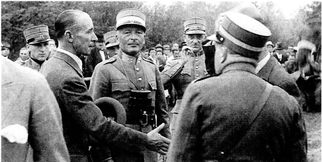
Prima della partenza 25 settembre 1936 alla tenuta Bally: Al centro il futuro generale Enrico Guisan, allora ancora colonnello. La sua passione per il cavallo diverrà poi proverbiale in tutta la Svizzera: mai nessuno ebbe a poterlo vedere vestito con la tenuta militare di gala e pantaloni lunghi, ma sempre con stivali e speroni.