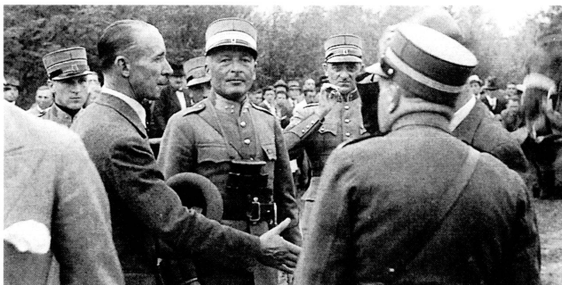
Prima della partenza 25 settembre 1936 alla tenuta Bally: Al centro il futuro generale Enrico Guisan, allora ancora colonnello. La sua passione per il cavallo diverrà poi proverbiale in tutta la Svizzera: mai nessuno ebbe a poterlo vedere vestito con la tenuta militare di gala e pantaloni lunghi, ma sempre con stivali e speroni.