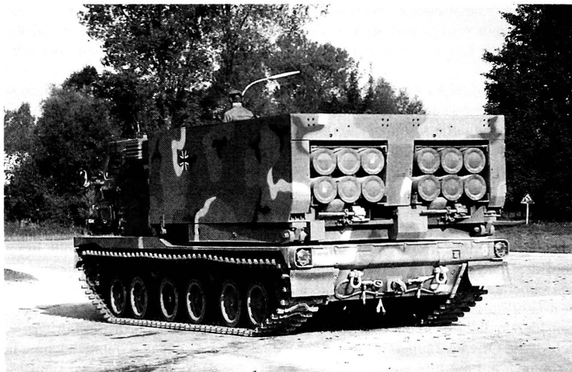
Un lanciarazzi multiplo MLRS dell'Esercito tedesco; nonostante le riduzioni la Germania manterrà in linea un Esercito moderno ed efficace.