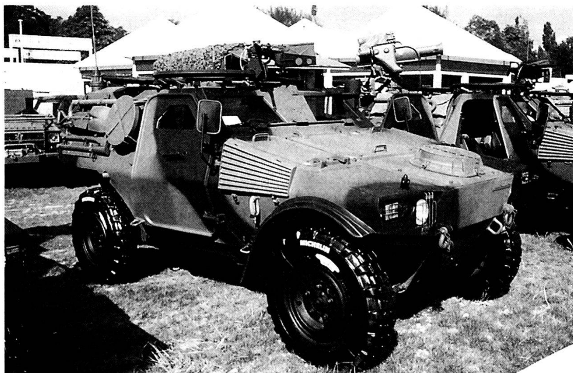
L'Esercito tedesco ha emesso un requisito per l'acquisizione di blindati ruotati leggeri.