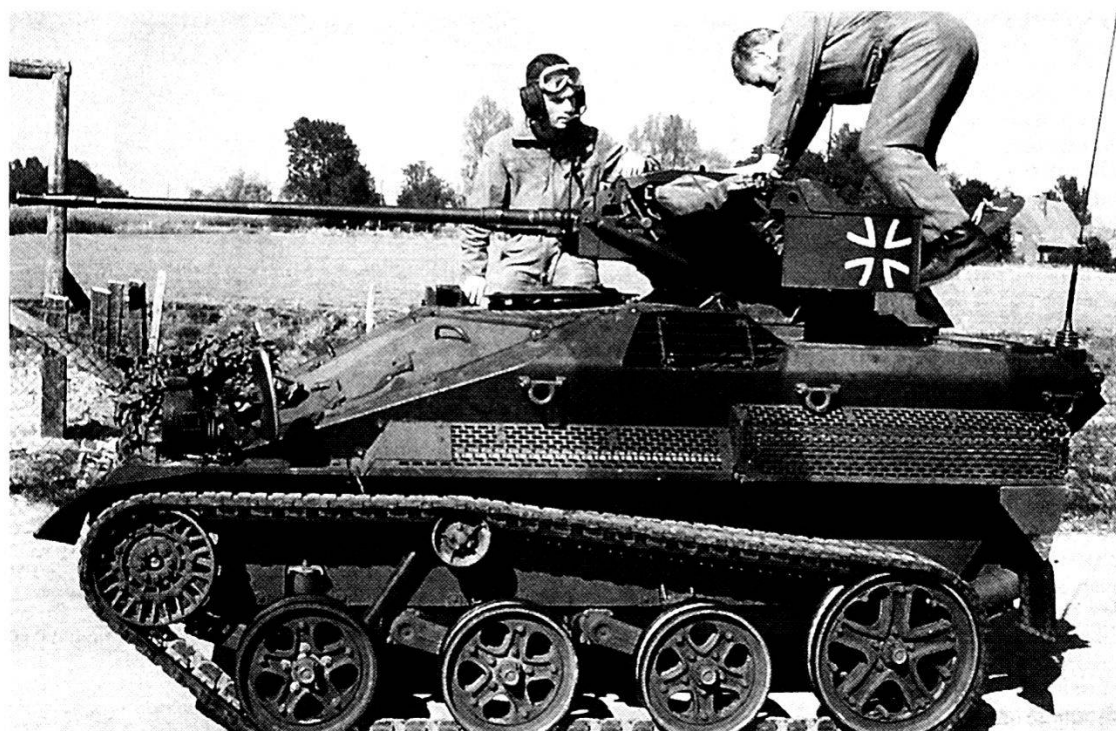
Un Wiesel dei parà tedeschi; una Brigata aeromobile fa parte della Divisione multinazionale che opererà nell'ambito delle Forze di Reazione Rapida.