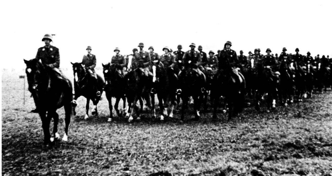
Ultima sfilata del rgt drag 1 ad Avenches il 4 novembre 1973.