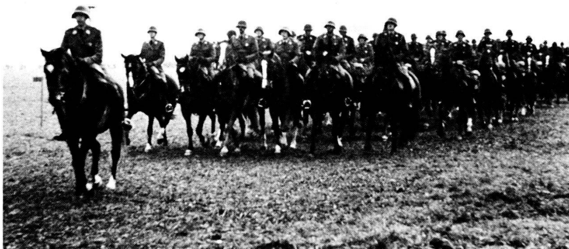
Ultima sfilata del rgt drag 1 ad Avenches il 4 novembre 1973.