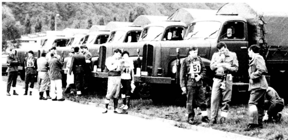
In attesa del trasporto