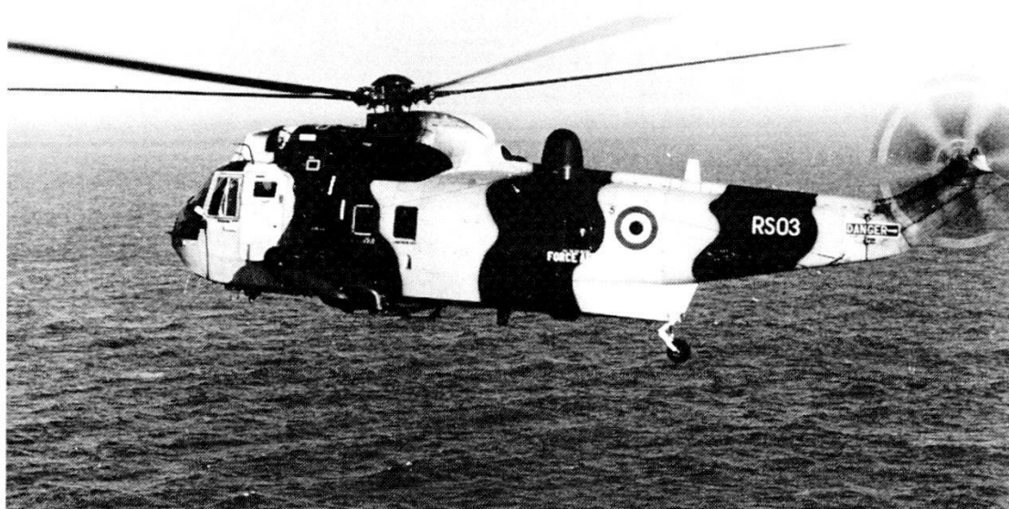
Il Sea King MK 48 delle forze aeree belghe.