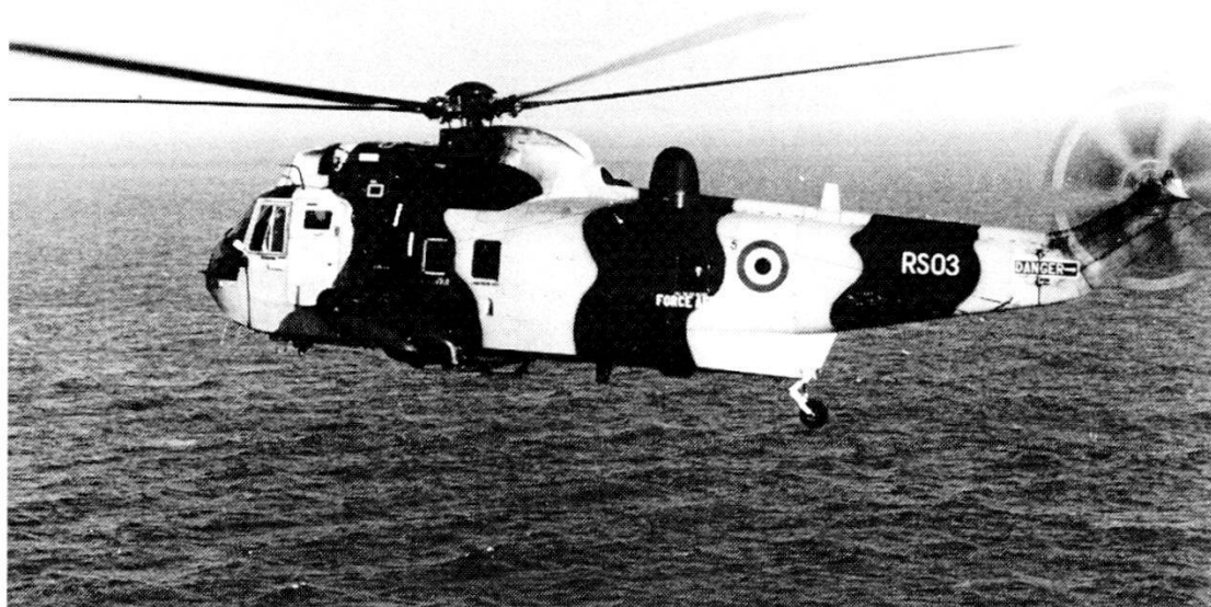
Il Sea King MK 48 delle forze aeree belghe.