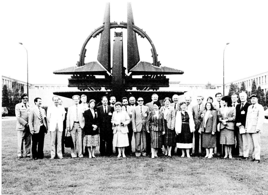
I congressisti riuniti davanti al palazzo della NATO a Evere.