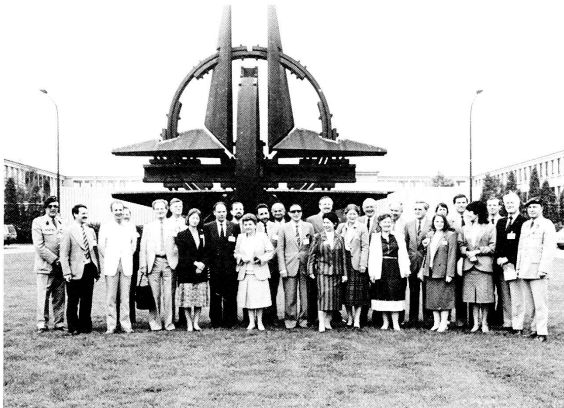
I congressisti riuniti davanti al palazzo della NATO a Evere.