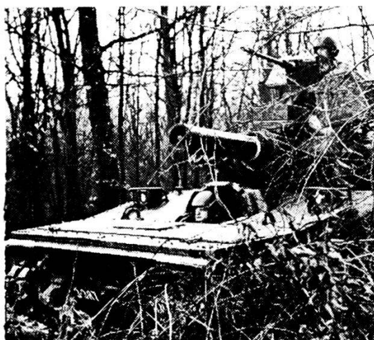
Cavalleria corazzata in posizione al coperto.

è pure all'altezza delle necessità. I sistemi d'armi del tipo «Hawk-Nike-Hercules, Chappararral, Vulcan e Redeye» conferiscono alla difesa contraerea una eccellente efficacia. Il sostegno di combattimento delle truppe del genio è stato alquanto potenziato con la fornitura di moderni mezzi di traghetto. Annualmente circa 90.000 soldati americani — tra cui molti per la prima volta — arrivano in Europa. Essi sono già formati militarmente e possono essere impiegati quali soldati di valore completo . Nell'ambito dei reparti viene continua-