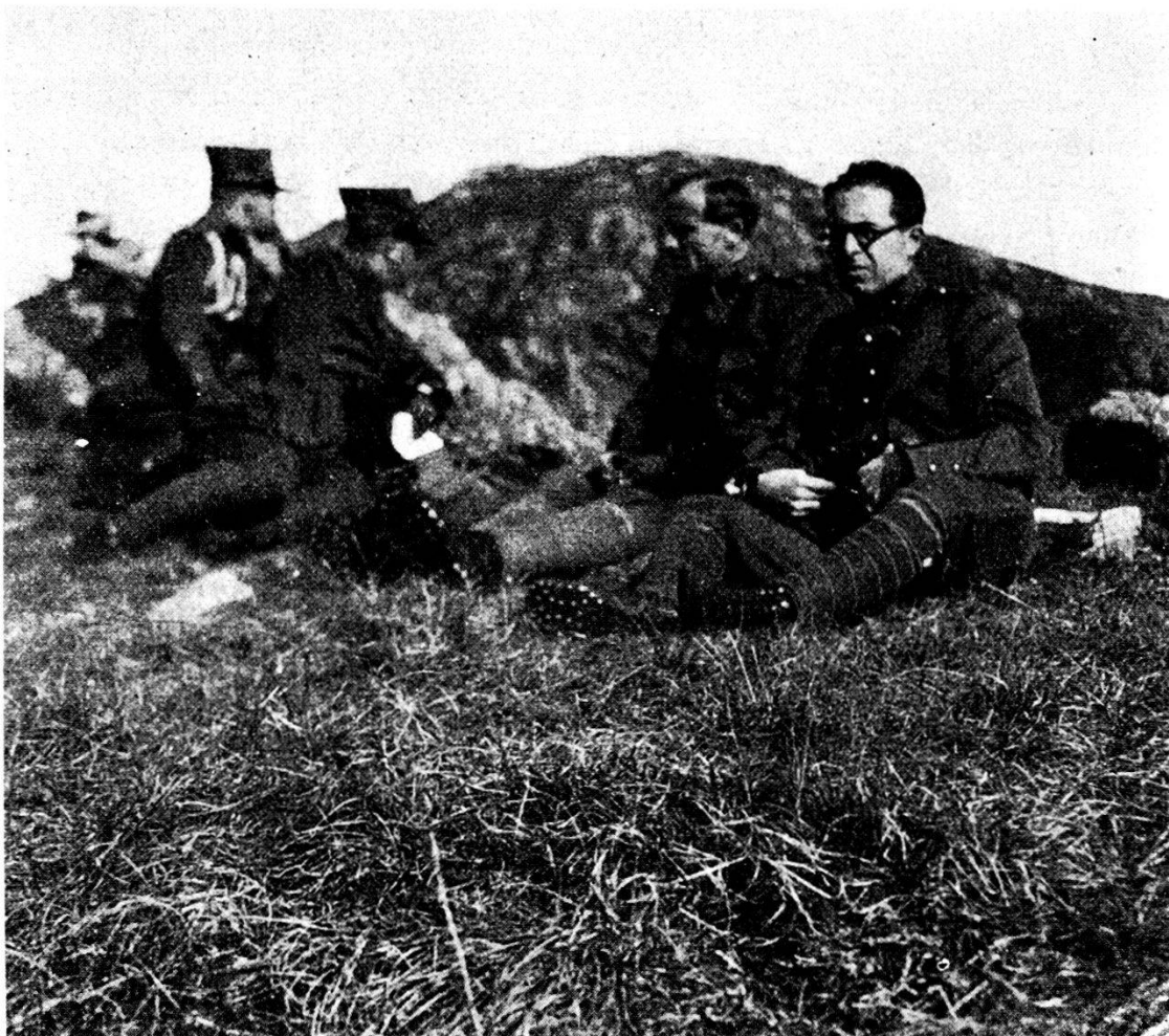
Alle manovre. Sosta.