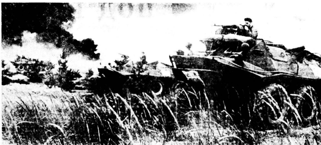
BTR 60 sostengono con il fuoco l'azione dei granatieri corazzati appiedati

Nel combattimento d'incontro, un attacco con blindati che trasportano truppa è appropriato soltanto se il nemico è di pari forza oppure più debole, qualora esso sia attaccato di sorpresa o si trovi in una prontezza di combattimento inferiore. Ove il nemico si ritirasse su posizioni difensive dopo un combattimento d'incontro con esiti a lui sfavorevoli, la questione a sapere se occorre attaccarlo sui blindati può essere risolta unicamente dopo che la nostra esplorazione abbia ottenuto informazioni esatte soprattutto per quel che concerne la difesa anticarro del nemico. Si tenga presente che pressoché tutte le formazioni in marcia dispongono di blindati, artiglieria ed armi anticarro che possono in po-