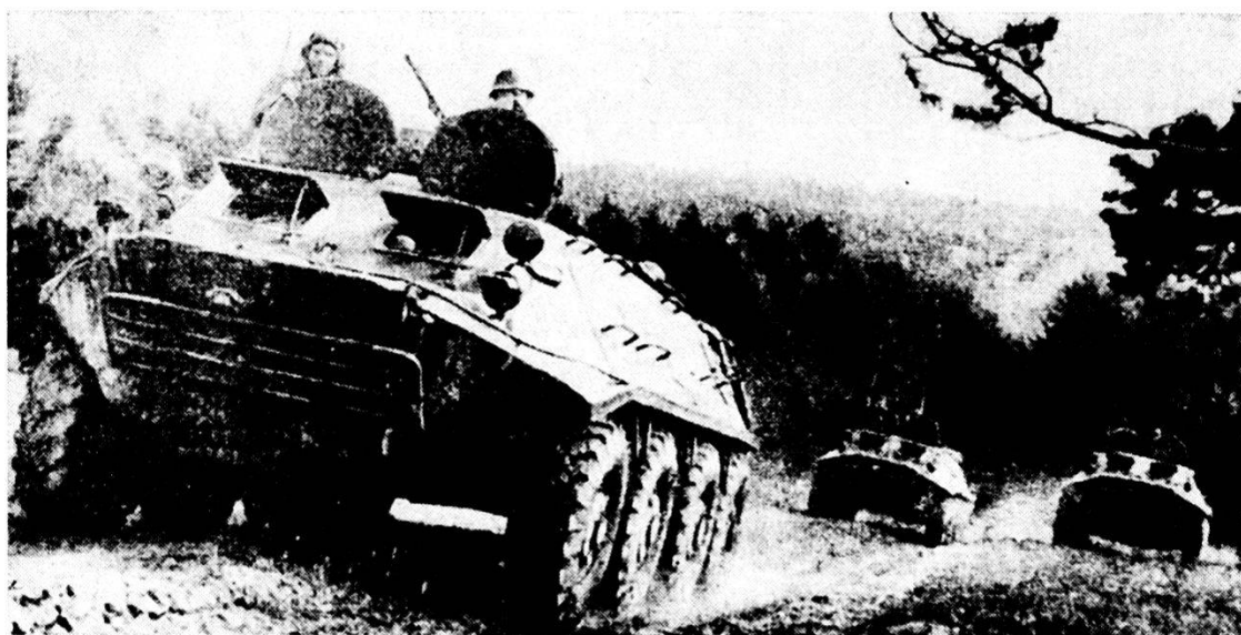
Veicoli blindati di accompagnamento BTR 60 in marcia di avvicinamento

nei blindati è possibile soltanto se il difensore viene bloccato con l'impiego di armi A e se la difesa ac del battaglione di fronte è stata completamente annientata. Il combattimento in profondità e l'inseguimento offrono altre possibilità per attaccare restando nei blindati. Un impiego corretto dei veicoli blindati di trasporto nella difesa rafforza la capacità difensiva. La soluzione d'adottare a seconda delle circostanze dipende evidentemente dal terreno. Occorrerebbe curare d'impiegare questi veicoli blindati 200 m e più dietro la LAR, lungo gli assi di penetrazione, all'orlo dei pendii od interrati. Da queste posizioni essi possono intensificare il fuoco fiancheggiante e battere zone d'ombra, garantire la copertura dei granatieri ed essere posti di riposo durante le pause del combattimento. Singoli veicoli possono pure essere immediatamente impiegati nei caposaldi di sezione oppure stare in agguato nelle profondità del sistema difensivo. La difesa deve essere condotta in modo attivo e mobile (contrattacchi, avanzate, protezione dal fuoco delle armi A nemiche). Mette conto sempre ricordare che i veicoli blindati per il trasporto di truppe sono particolarmente efficaci nella difesa se sono impiegati come mezzo di trasporto mobile e non come sorgente di fuoco statica.