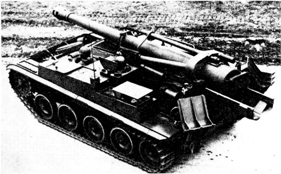
Il nuovo obice semovente francese calibro 15.5 cm. fissato su scafo AMX