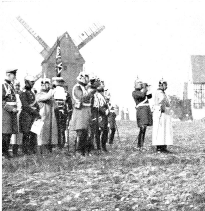
L'imperatore Guglielmo II alle manovre.