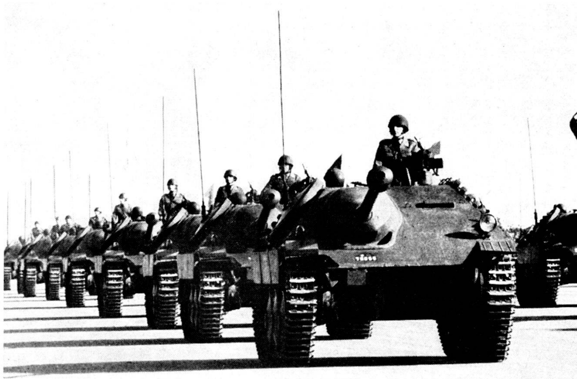
Carri AMX 13 alla sfilata del 2. CA di camp.