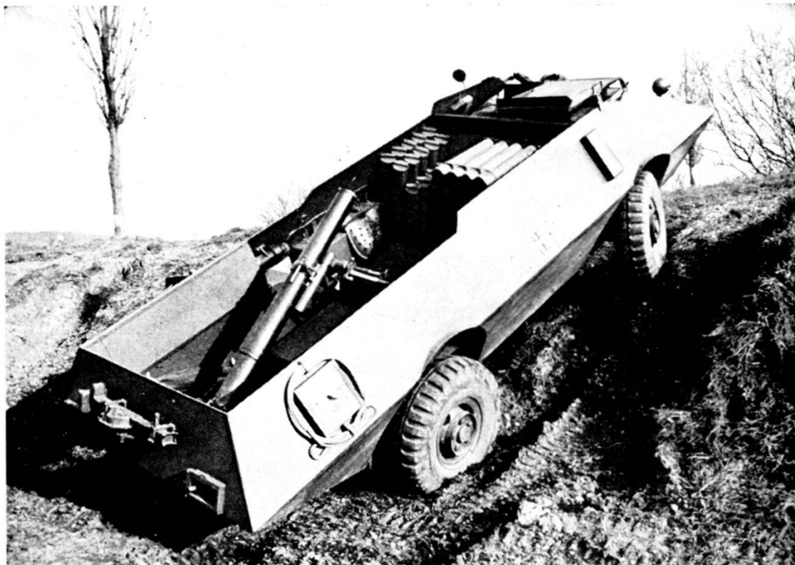
Svizzera: lanciamine pesante 12 cm semovente (scafo « MOWAG »)