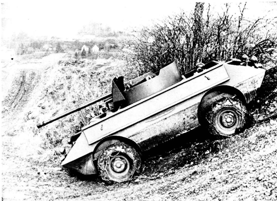
Cannone anticarro 9 cm semovente. Scafo « MOWAG » (Motorwagenfabrik AG. Kreuzlingen) a doppia guida.