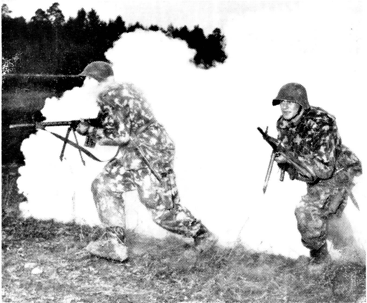
L'impiego del nuovo fucile d'assalto: annebbiamento con granate ed immediato impiego della medesima arma con munizione ordinaria.