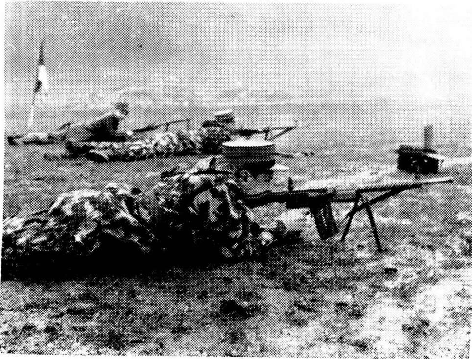
Dimostrazioni col nuovo fucile d'assalto