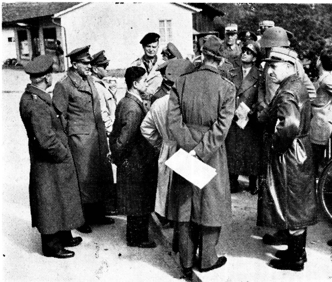
Addetti militari esteri hanno seguito le manovre.

Passarono così per quasi cinque ore consecutive, secondo l'ordine di battaglia, 25.000 uomini, 3.000 autoveicoli, 700 cavalli, 30 carri armati, 50 aeroplani, di cui la metà a reazione: una massa impressionante di uomini e mezzi, come finora da noi non era mai stata veduta, accolta dall'entusiastico applauso dei presenti.