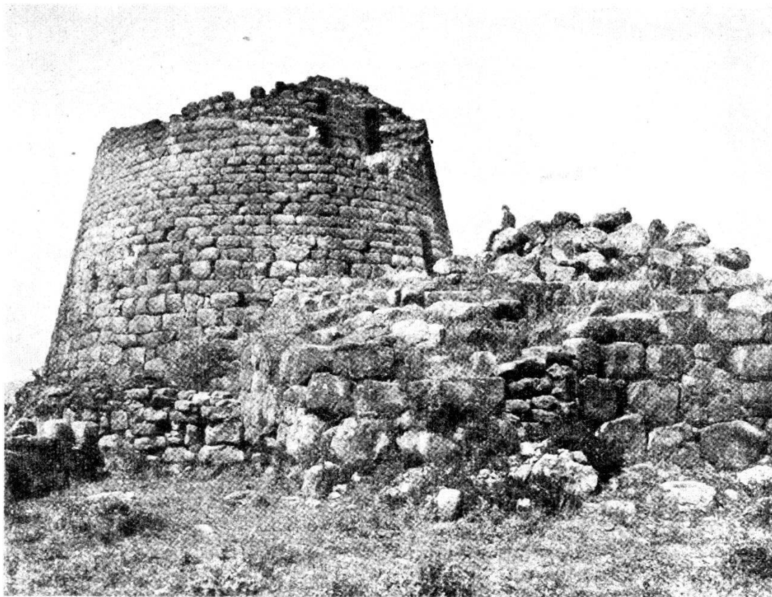
Un nuraghe (a Torralba).

assoluta, niente militare, senza preoccupazioni di protezione del tergo e di difesa sui fianchi; esse non erano quindi teste di ponte destinate ad ingrandirsi e a penetrare, ma colonie, in funzione del mare e del porto.