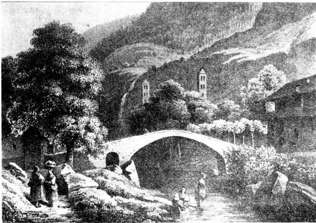
Giornico in una vecchia stampa: il ponte sul Ticino ed il campanile della chiesa di San Nicolao (a destra).

Quando, dopo il 1870, i prigionieri furono trasferiti al Penitenziario cantonale costruito a Lugano, divennero disponibili per l'arsenale nuovi locali, tra cui le prigioni femminili ove venne installata la prima sala d'armi.