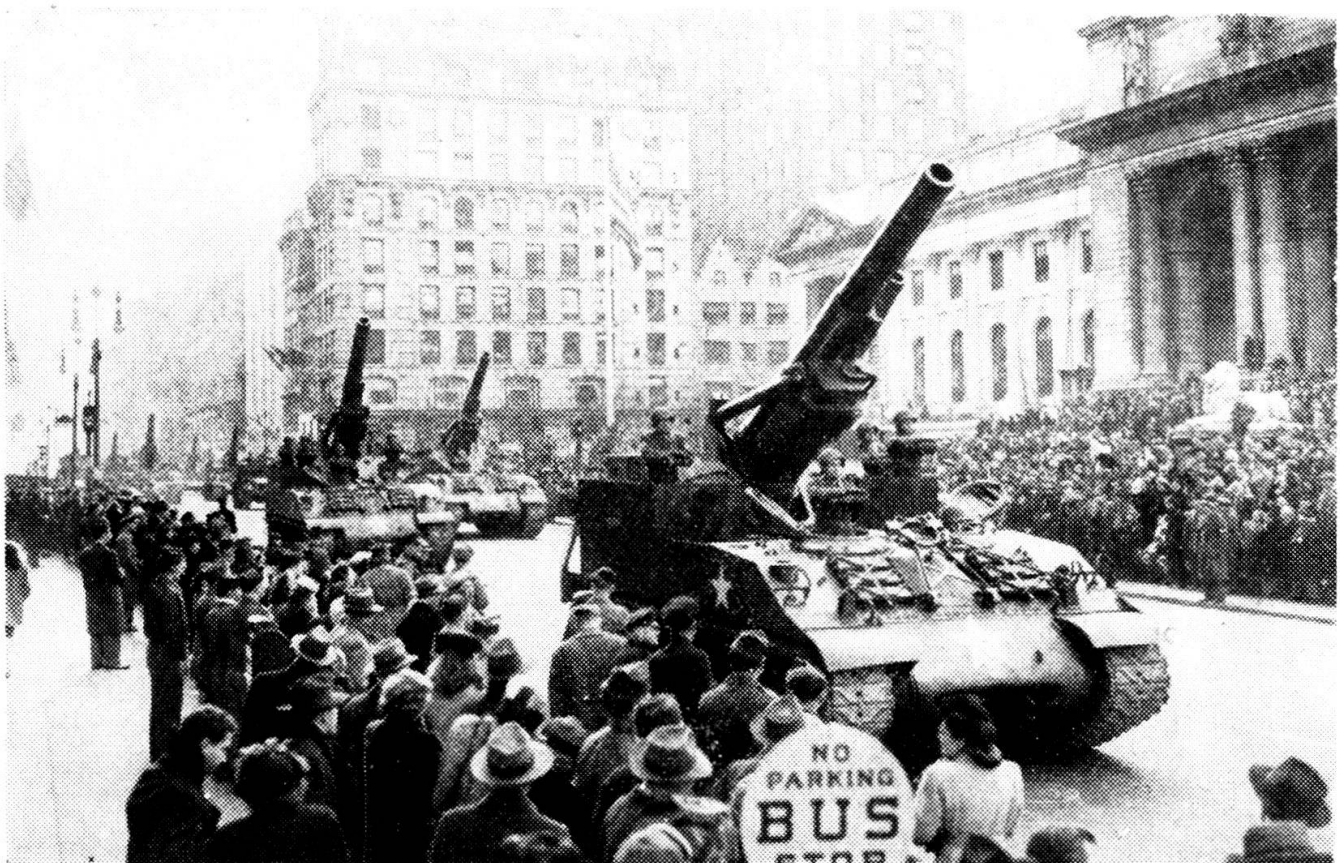
Artiglieria pesante motorizzata. Una divisione americana sfila nelle vie di New York con i suoi cannoni pesanti motorizzati (obici da 200 mm.).