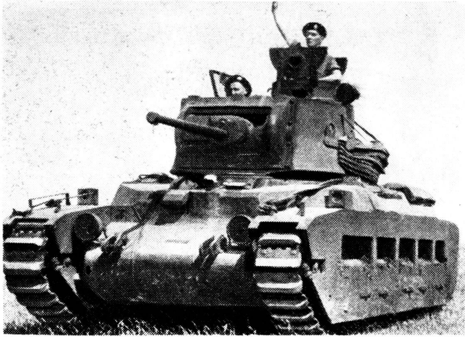
La «Waltzing Mathilda», carro armato britannico da combattimento.