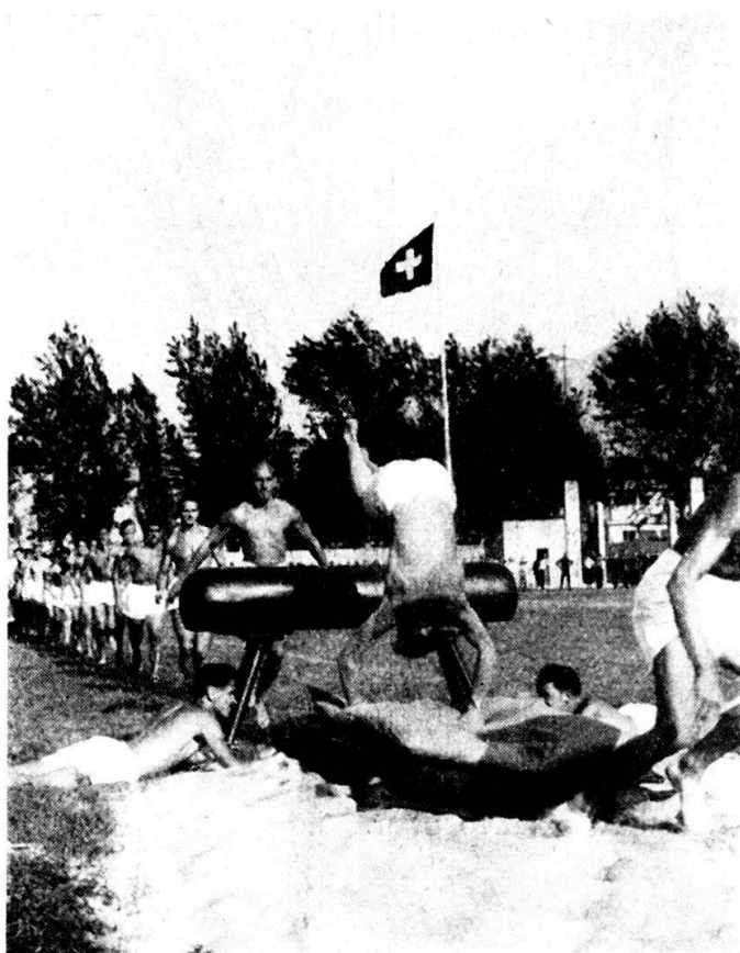
Locarno: esercizi al cavallo eseguiti da militi del Centro Atletico Br. fr. 9 (estate 1940).

Fondamentale, senza dubbio, è stata l'attività svolta per tutto il periodo che vado illustrando in seno alle compagnie. Numerosi sono stati i comandanti che, persuasi dell'importanza dell'educazione fisica per la formazione del milite, sono passati all'iniziativa indicando concorsi interni allo scopo di accendere e di mantenere vivo lo spirito di emulazione e l'entusiasmo, atti a potenziare nella misura del massimo raggiungibile, l'efficienza fisica dei loro uomini. A tale scopo si sono svolte le frequentatissime gare di pattuglia, le corse campestri, le gare di sci, i concorsi di atletica, le gare di calcio e di nuoto ecc., accanto ai regolari concorsi di tiro. Manifestazioni svoltesi