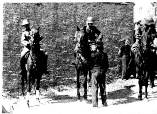
I cavalieri sono in sella...