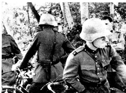
I ciclisti aspettano...