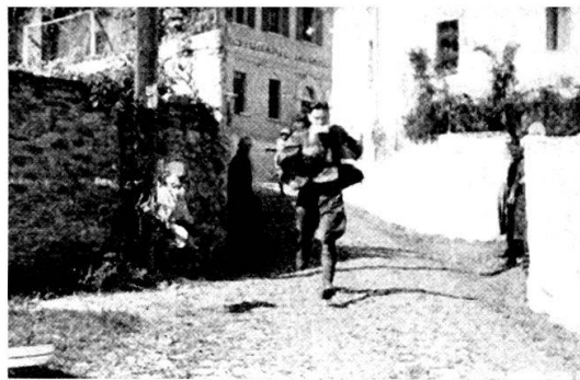
I ten. Forni e Lanzi arrivano a Torricella

Un puntino nero viene giù attraverso i prati, si nasconde dietro i Mt. Moneda, ricompare per buttarsi giù subito verso il fondo