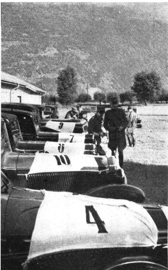
Le macchine ben allineate...