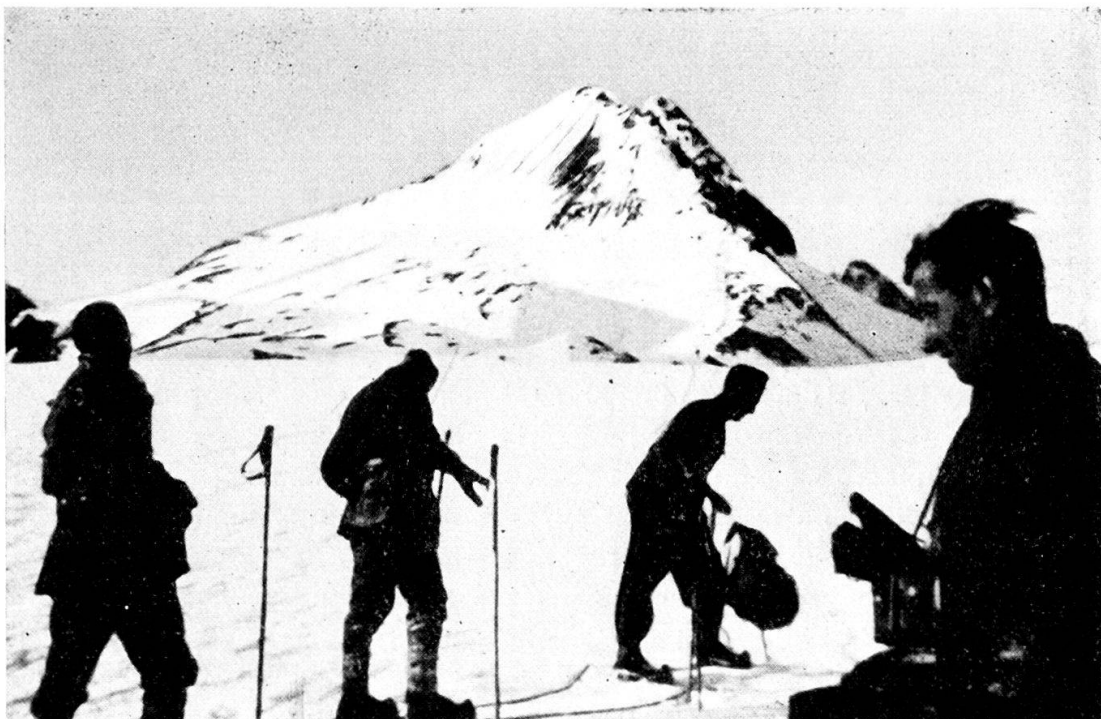
Siedelrothorn (3292) - Verso il Blindenhorn

Quest'anno ho avuto l'onore ed il piacere di partecipare al corso per Pattuglie Sciatori del Reggimento 30 che si è tenuto ad Andermatt, dall'8 al 20 febbraio, contemporaneamente al Corso di Ripetizione della Cp. II/95. Le impressioni riportate sono tanto forti che credo quasi un dovere di farle conoscere ai miei camerati che già ne hanno provate di uguali e, più ancora, a quelli che non sanno decidersi a rinunciare ai domenicali ozi cittadini per salire in cerca dei campi immacolati di