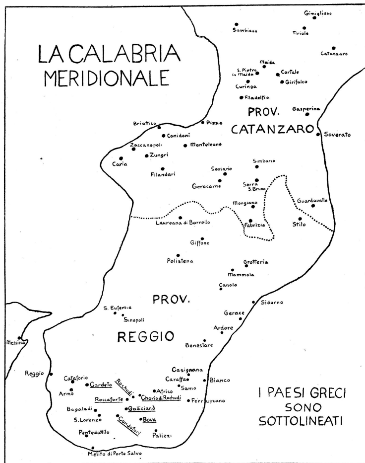
(Da G. Rohlfs, La terminologia pastorale dei Greci di Bova , RLiR, II, p. 300).