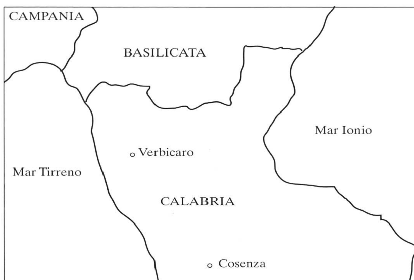
Figura 1. Posizione geografica di Verbicaro

diretto lessicale, infatti (il tipo Gianni ha mangiato la mela ), l'accordo si mantiene (come nei dialetti alto-meridionali più conservativi) solo se il participio presenta flessione interna metafonetica, mentre è agrammaticale se il participio ha flessione esclusivamente affissale (v. il §5.2). Di questa particolarità, che il verbicarese condivide con alcuni altri dialetti parlati entro l'area Lausberg o nelle immediate vicinanze, si offrirà un inquadramento geolinguistico al §7, dopo aver perfezionato al §6 la descrizione delle condizioni verbicaresi con l'analisi delle differenze che il dialetto innovativo oggi presenta rispetto a quello dei più anziani: l'innovazione consiste nel divenire opzionale dell'accordo in tutti i costrutti riflessivi, che invece lo presentano categoricamente nel verbicarese conservativo. Anche questo mutamento in corso, così come la perdita selettiva dell'accordo con l'oggetto diretto lessicale (fronte quest'ultimo sul quale le due varietà verbicaresi non si differenziano), si inquadra entro la generale deriva diacronica romanza che ha visto una progressiva riduzione dell'accordo del participio passato nelle perifrasi verbali perfettive.