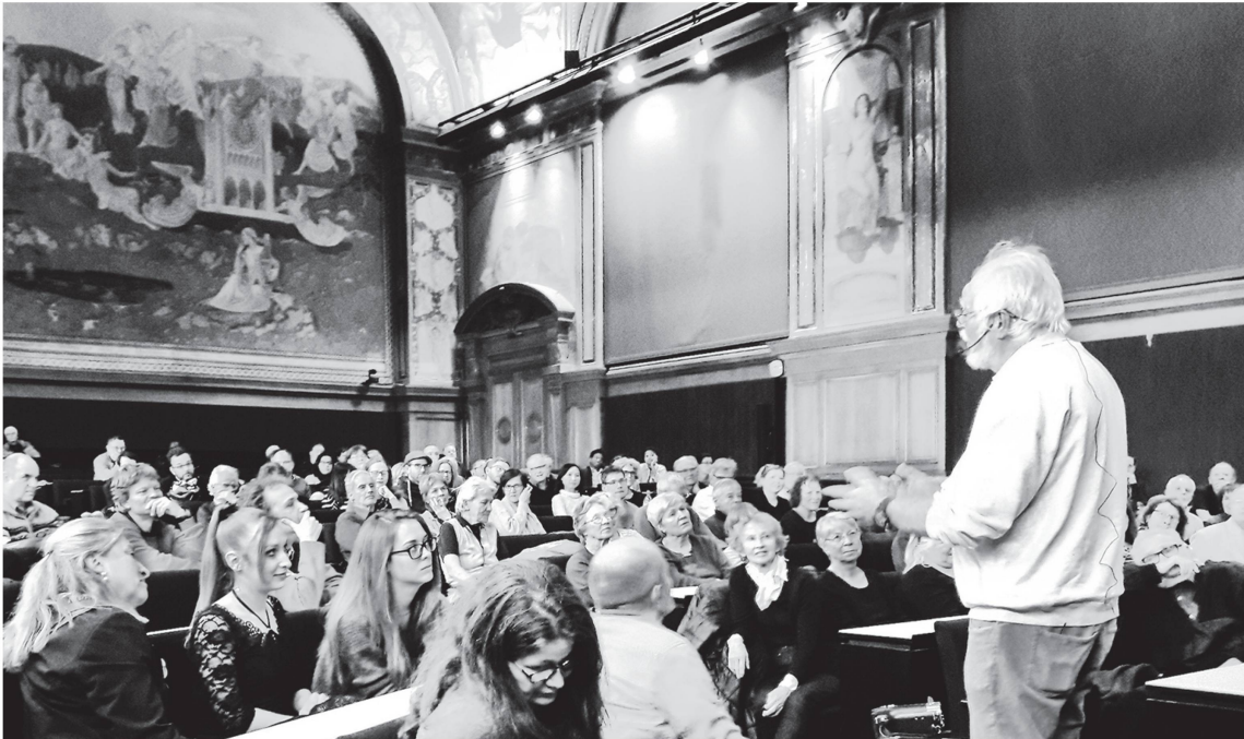
Conférence donnée par le Prof. hon. UNIL Jacques Dubochet, Prix Nobel de chimie 2017, lors de l'Assemblée générale de la SVSN, tenue le 13 mars 2019 à l'Aula du Palais de Rumine à Lausanne, SVSN 20190313.

de travail et son salaire. On note aussi l'achat en commun d'une machine à écrire puis d'outils informatiques.