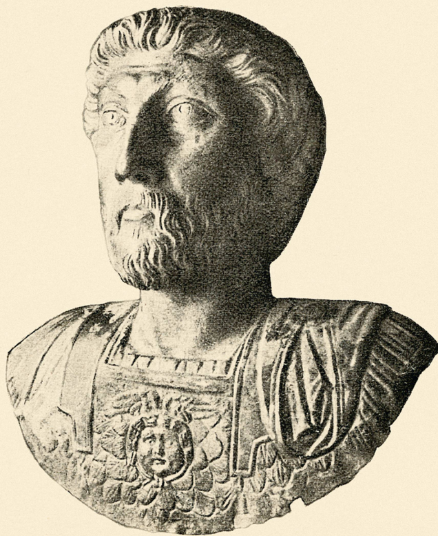
BUSTE EN OR DE MARC AURÈLE

Bulletin N° XIV avec quatorze planches hors-texte