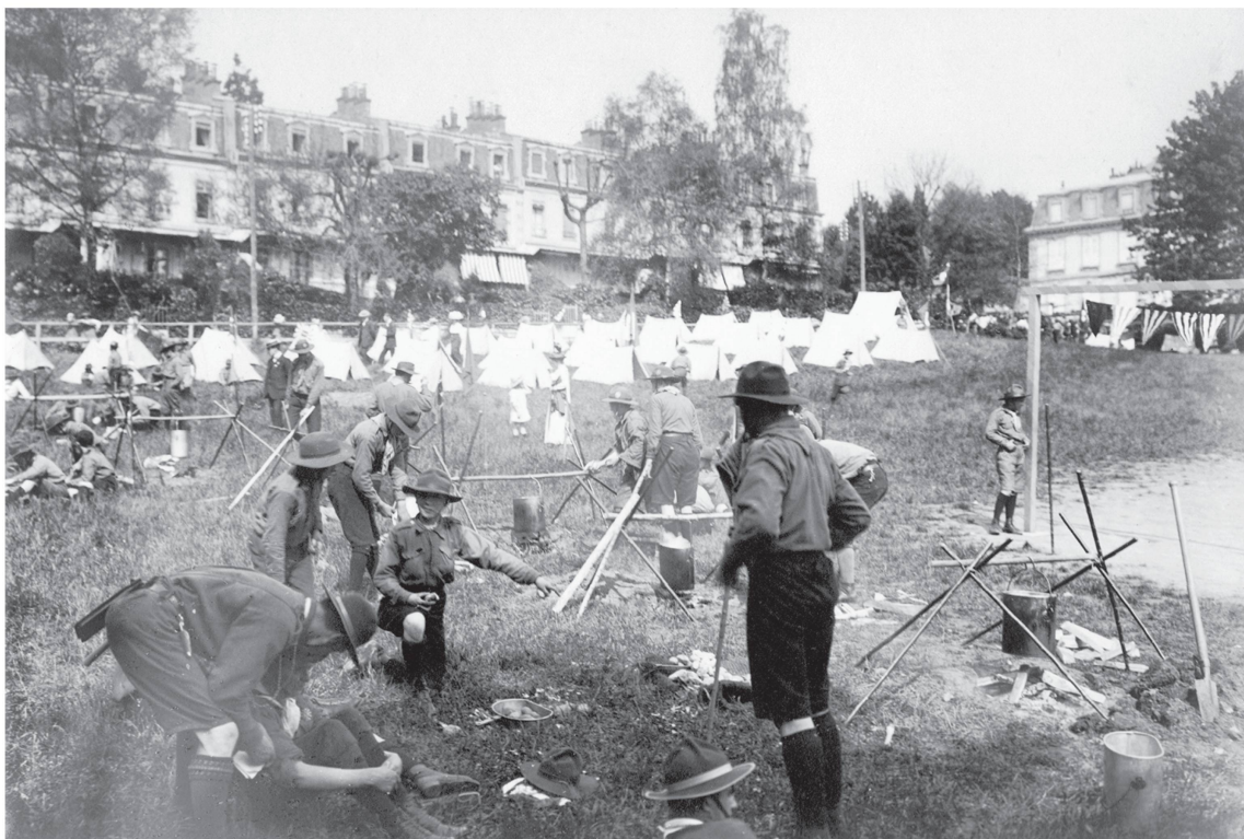
Camp démonstration des éclaireurs lausannois sur le pré Mercier à l'occasion du congrès du Comité international olympique en mai 1913.

Durant les deux conflits mondiaux, éclaireuses et éclaireurs se mettent à disposition des autorités et participent à l'effort de mobilisation. De partout des demandes affluent pour porter missives et vivres aux troupes stationnées à la frontière, aider aux travaux de la campagne, servir d'auxiliaires de la Croix Rouge et encore aider à l'accueil des réfugiés.