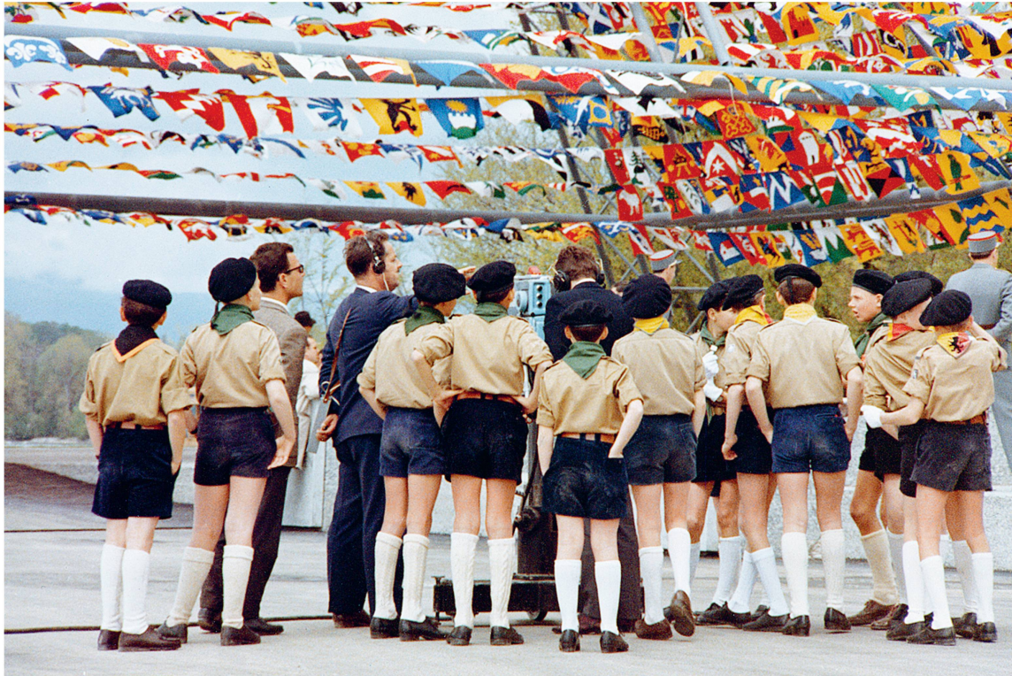
À l'Expo 64 : éclaireurs suivant le travail d'un caméraman.

rejoindre progressivement l'association dissidente 31 . En 1977, le scoutisme vaudois se réunifie sous le nom d'Association vaudoise des éclaireurs (AVE) et il lui faut encore huit ans pour stabiliser ses effectifs autour des 3000 membres.