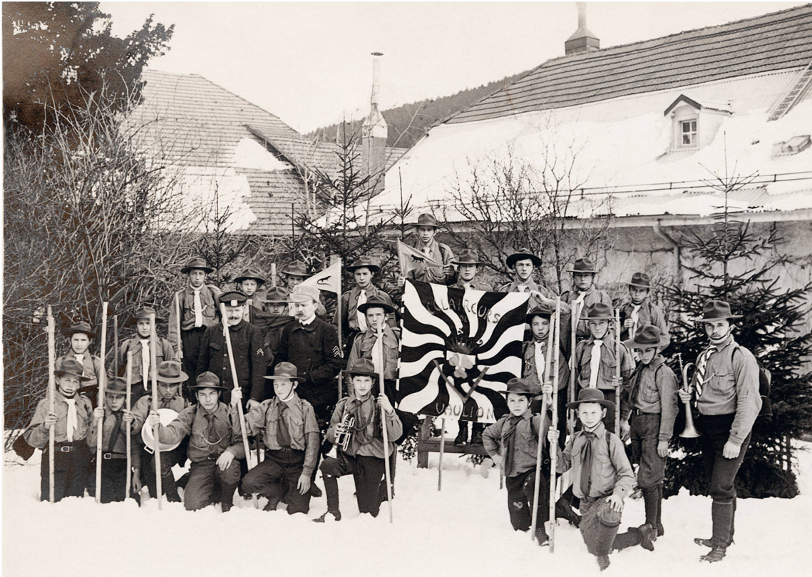
La troupe de Vaulion posant autour de son drapeau vers 1913.