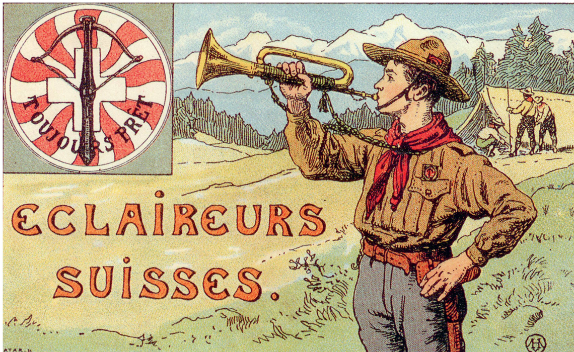
Carte postale des éclaireurs suisses vers 1919.

sur le Plateau (de Grandson à Lausanne) et dans quelques gros bourgs que sont Moudon, Vallorbe ou Sainte-Croix, démontre que le scoutisme est un mouvement avant tout citoyen. Dans les villages, les troupes naissent souvent à l'initiative d'un pasteur ou d'un instituteur et celles-ci s'étiolent par la suite faute de relève. Isolées, elles souffrent du manque de contact entre elles et se sentent parfois délaissées. À quelques exceptions, ces unités, souvent trop petites ou repliées sur elles-mêmes, ne peuvent organiser d'activités d'envergure et peinent à se faire connaître des autorités ; elles manquent d'appuis moraux, financiers et ne jouissent pas de la même considération qu'en ville 17 . De plus, en ce début de XX e siècle, les petits villageois sont encore souvent requis par les travaux des champs ; ils ont moins de temps libre et gardent un lien direct avec la nature.