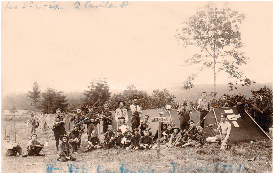
Le deuxième camp cantonal au chalet de Villars à Peney-le-Jorat en 1921 : la troupe de Sainte-Croix. ACV, PP 522/270.

unité du canton dont la date de création est connue. « La tâche des premiers instructeurs [chefs] de 1912 fut particulièrement difficile », se rappelle-t-il.