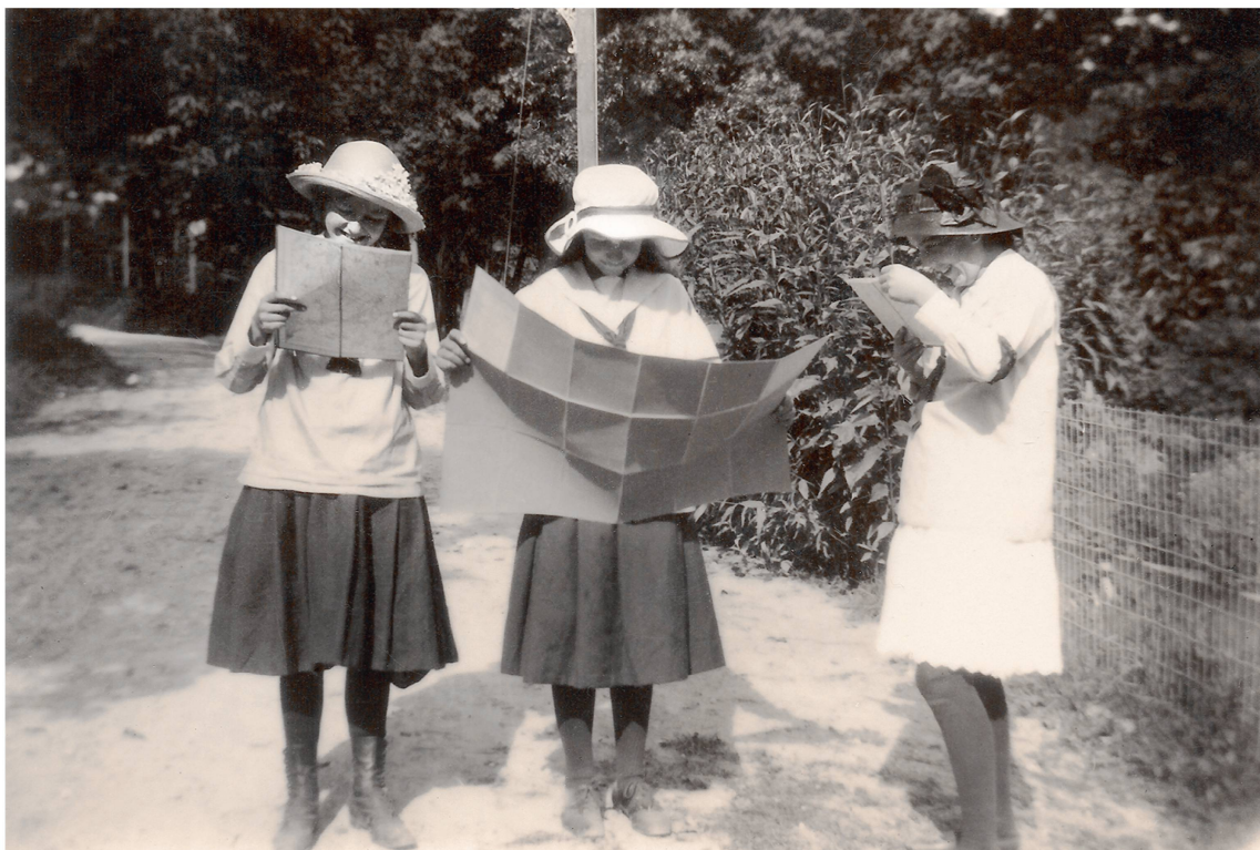
Lecture de carte chez les Maïentzettes, premières éclaireuses lausannoises en 1916 à Vufflens. ACV PP 1090/3.

Si l'on veut que la jeune fille soit aussi apte que ses frères à travailler dans le monde, il faut lui donner les mêmes occasions de se former le caractère, de devenir habile, de se discipliner, de se bien porter. Alors seulement on pourra attendre à ce qu'elle ait les mêmes possibilités d'activités que le jeune homme. 21