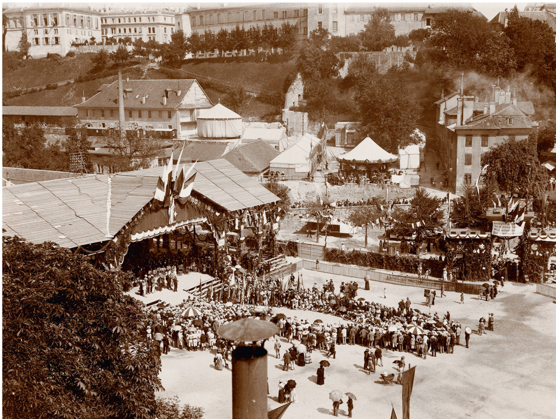
Anonyme, Fête cantonale de gymnastique sur la place de la Riponne à Lausanne, photographie, août 1893, coll. du Musée historique Lausanne.