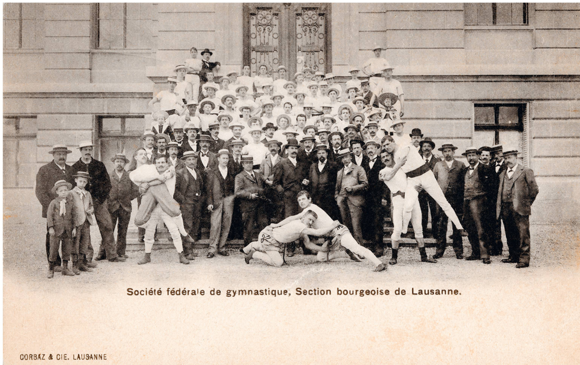
Anonyme, Section lausannoise de la Société fédérale de gymnastique, carte postale, vers 1900, coll. du Musée historique Lausanne.

organise dans ce but des cours pour moniteurs de lutte à la « campagne ». Le rapporteur du cours de Château d'Oex encourage le comité central à institutionnaliser l'organisation de fêtes de lutte régionales « ne demandant pas une mise en scène et des dépenses aussi considérables que les fêtes de gymnastique, [et qui] pourraient se donner même dans les villages du Gros de Vaud, du pied du Jura ou des Alpes » 47 . Notons que la promotion de la lutte à la SCVG, au-delà d'une volonté hygiéniste et unificatrice, passe aussi par la manifestation d'un certain puritanisme et d'une condescendance citadine. En effet, le rapporteur ponctue son appel au comité en ces termes : « Ce serait, croyons-nous, le moyen par excellence [les fêtes de lutte] de développer chez nos campagnards le goût de la lutte, les arrachant ainsi à des distractions peu patriotiques et parfois funestes. » 48 L'organisateur du cours de Corcelles-près-Payerne espère, quant à lui, que « ce cours sera le point de départ d'un travail nouveau et que plusieurs jeunes gens délaisseront les jeux de cartes et les soirées au cabaret pour pratiquer le noble art de la lutte » 49 .