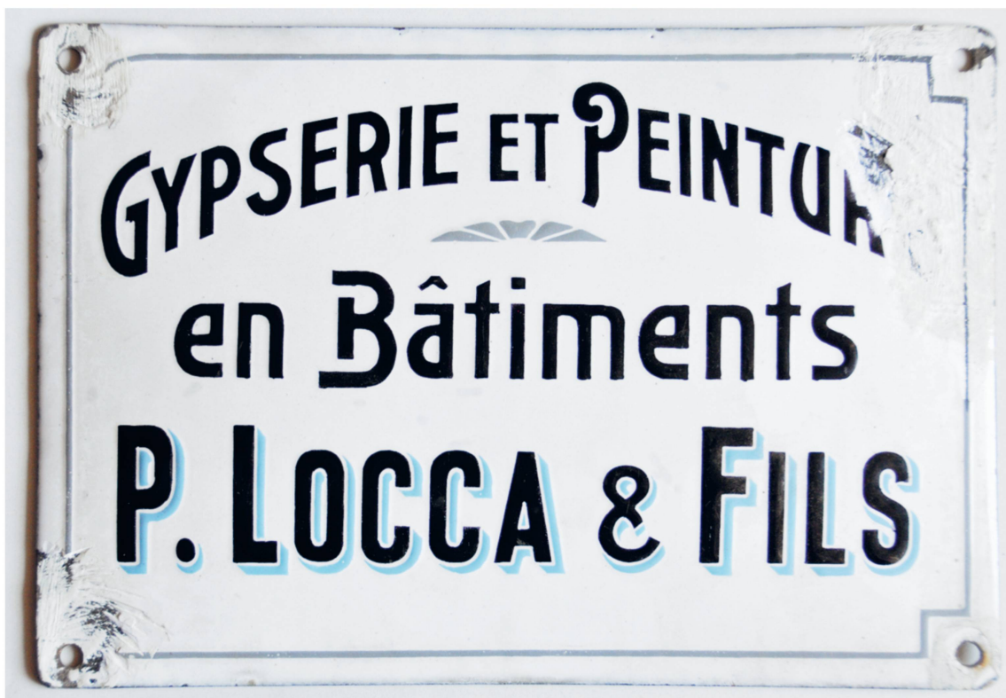
Enseigne de l'entreprise (env. 1900).

Haut-Adige. Cet exemple a l'avantage de nous replonger au cœur de ce qui constitue l'immigration du XIX e siècle: une immigration propre aux vallées alpines, tant italiennes que suisses, avec l'implantation de «relais» en plaine, là où se trouve le travail. Ce modèle de migration, essentiellement masculine, a fait l'objet de plusieurs analyses et l'on repère dans l'exemple aubonnois l'essentiel de ses caractéristiques: la combinaison entre migration saisonnière et migration définitive qui permet d'asseoir les bases de la filière migratoire, le système de relais qui s'instaure entre membres de la même famille ou du même village pour alimenter cette filière, le fait de partir seul ou à deux et non en groupe ou encore l'acquisition progressive d'une spécialisation professionnelle 3 . Ce modèle contribue au maintien d'une vie au village d'origine, les femmes ou un homme de la famille assurent le travail sur place, tout en offrant la possibilité de profiter des revenus supplémentaires provenant de l'émigration. La persistance de ces pratiques, reproduites de génération en génération, tend à les inscrire dans une