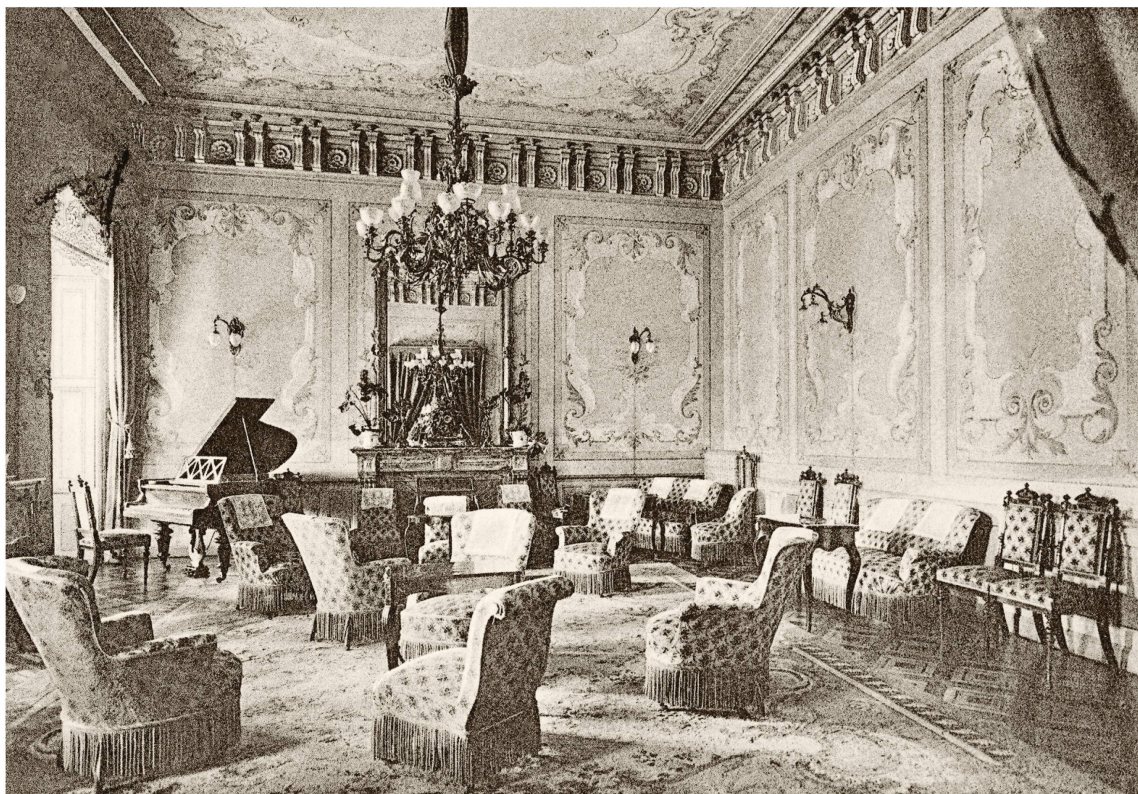
Éclairage électrique d'un salon de l'Hôtel Beau-Rivage à Ouchy (1908-1911).

La mise en place d'un système d'éclairage électrique nécessite toutefois de lourds investissements, tant financiers que techniques, qui vont parfois retarder l'introduction de cette commodité. À l'Hôtel Beau-Rivage, à Ouchy, la transformation du système d'éclairage au gaz en une installation électrique avec petite centrale hydraulique indépendante est repoussée jusqu'en 1894, moment où les administrateurs considèrent alors cette commodité comme prioritaire et indispensable :