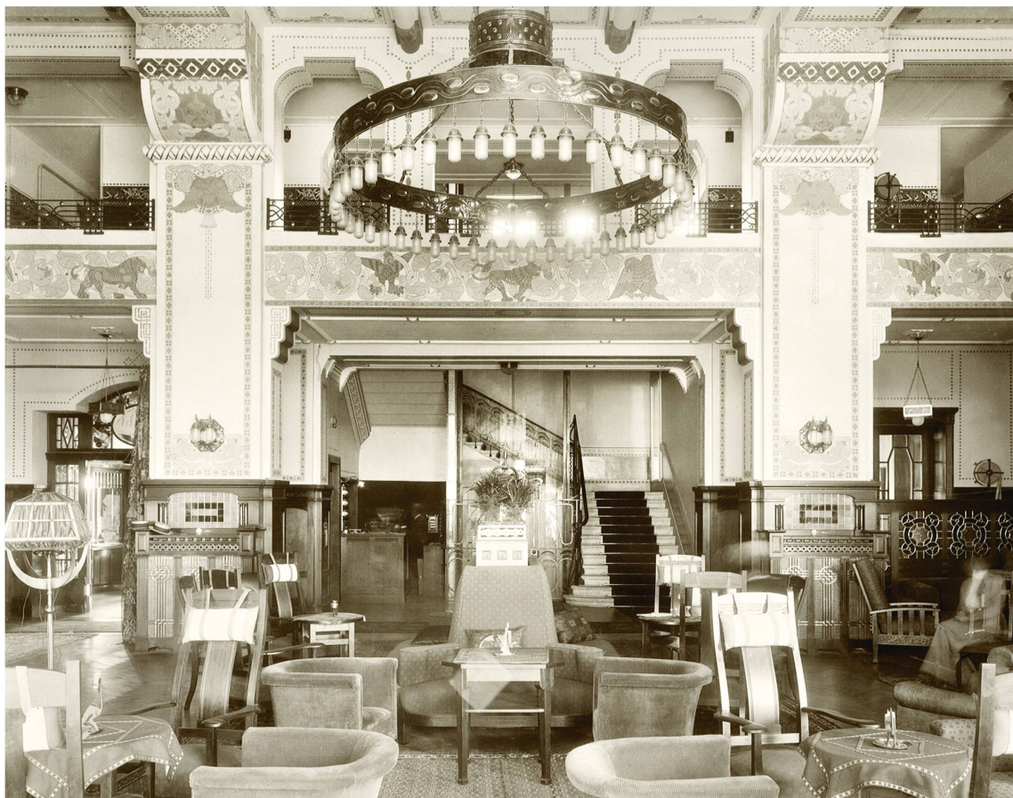
Éclairage électrique du hall d'entrée de l'Hôtel Royal de Lausanne, début XX e siècle.

Le Conseil [du Savoy-Hôtel n.d.a.] ne comprend pas que la Municipalité de Lausanne cherche à nuire à une nouvelle industrie [touristique n.d.a.] au lieu de chercher à la développer pour le bien-être et la prospérité de la ville entière! 31