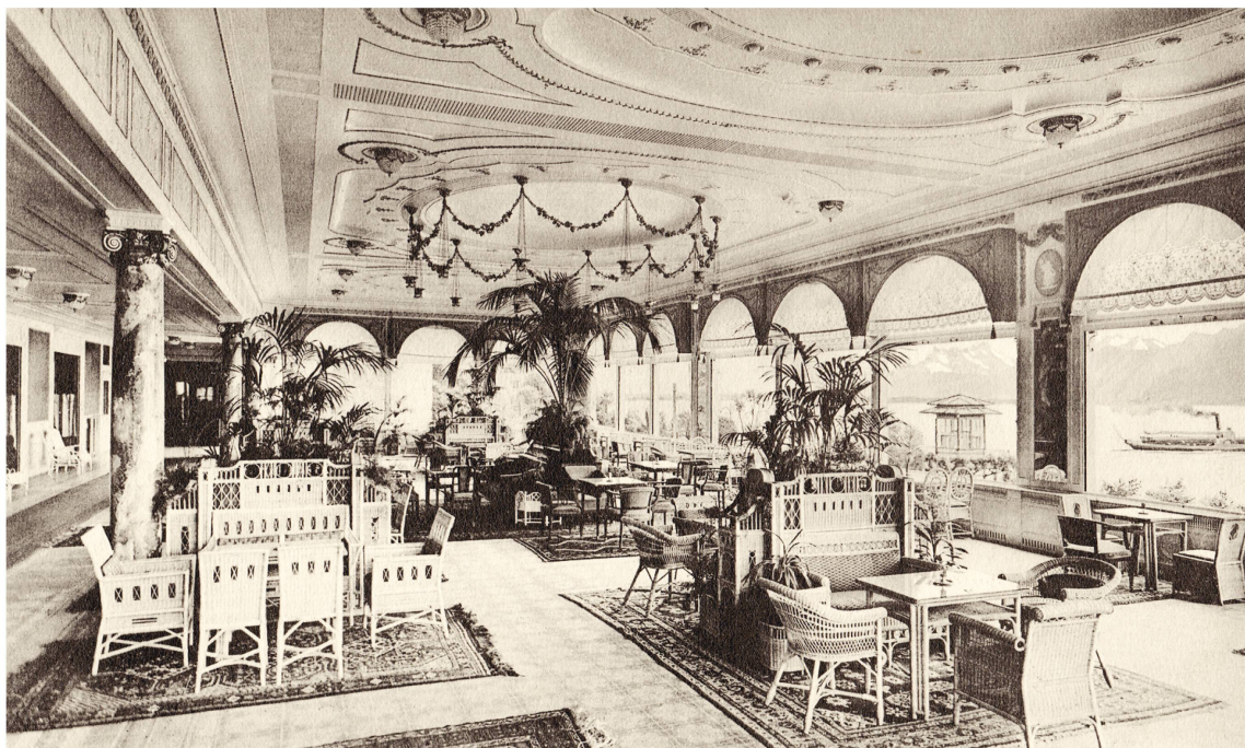
Éclairage électrique du jardin d'hiver du Grand Hôtel et Hôtel des Alpes de Territet, (1890-1915), carte postale, 140 × 90 mm.