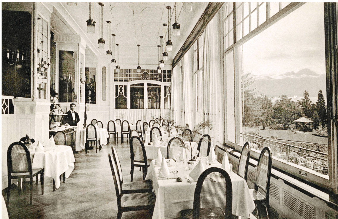
Éclairage électrique du restaurant de l'Hôtel Savoy à Lausanne, (1909-1920).