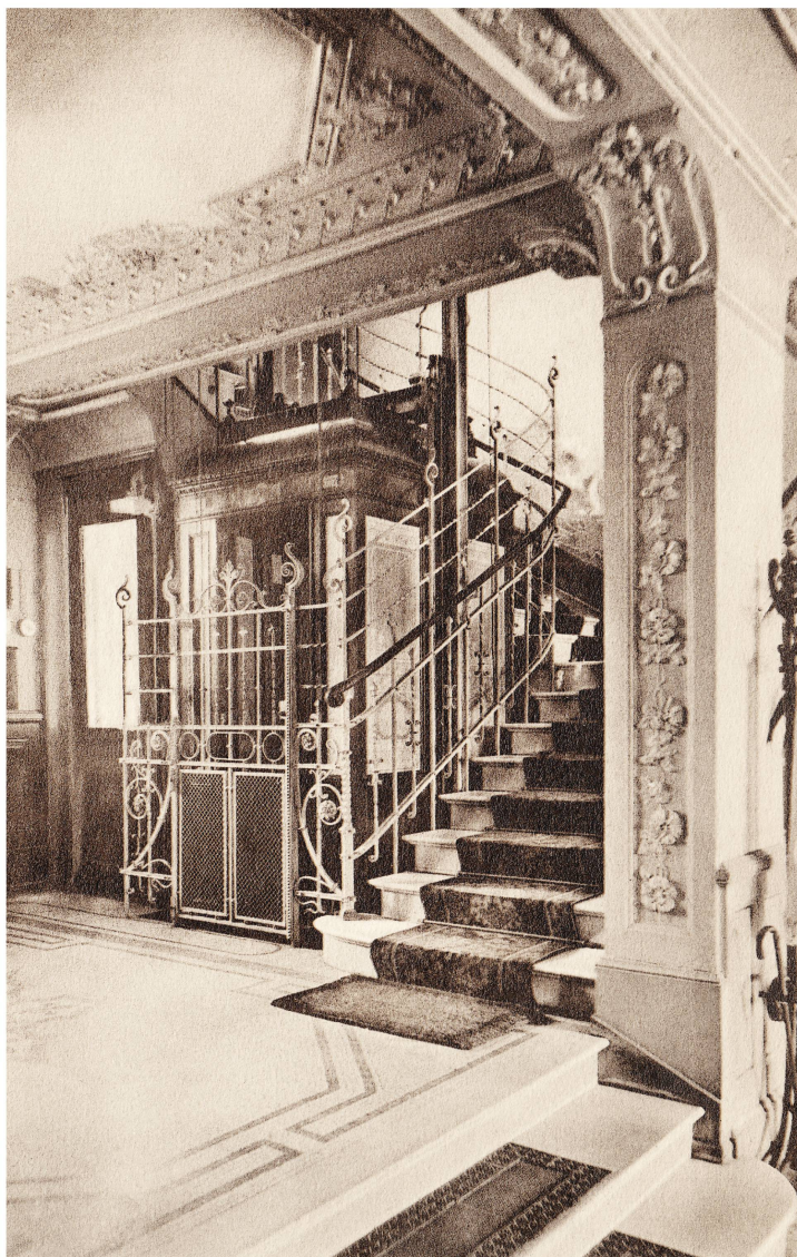
Ascenseur et cage d'escalier du Grand Hôtel de Clarens, (1905-1915), carte postale, 140 × 90 mm.

raccordé au réseau d'eau sous pression fournit par le LO qui lui garantit une pression minimum de 20 atmosphères, nécessaire à la manœuvre de leur appareil. Vendue à un prix de 10 ct le mètre cube, l'eau utilisée comme énergie reste bon marché. Écartant l'option de mouvoir l'ascenseur par leurs propres sources d'eau emmagasinées dans un nouveau réservoir construit à la Croix d'Ouchy, les administrateurs du Beau-Rivage renoncent une seconde fois à acheter de l'eau provenant de la SEAUL, car cette dernière ne peut leur garantir une pression plus grande que 8 atmosphères 23 .