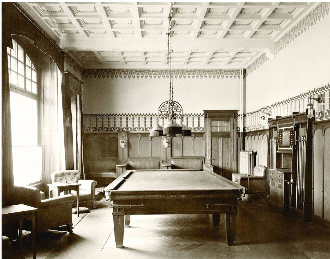
Éclairage électrique du billard de l'Hôtel Royal de Lausanne, début XX e siècle.

Lausanne, l'installation d'accumulateurs est décidée, servant à emmagasiner l'électricité fournie par la ville durant la nuit à un taux préférentiel et permettant ainsi de réaliser des économies considérables 30 . Lors de la construction du Savoy-Hôtel à l'avenue de Cour à Lausanne, entre 1909 et 1911, les administrateurs adoptent quant à eux une solution multiple: une production privée de courant électrique grâce à un moteur diesel, l'achat d'une batterie d'accumulateurs et, par prudence et en cas de panne, un raccordement au réseau électrique de la ville. La Municipalité, qui accepte dans un premier temps cet arrangement à la condition que l'hôtel consomme un minimum de 1500 fr. d'électricité par année, menace par la suite les administrateurs de bloquer l'approvisionnement suite à des querelles et malentendus. De laborieuses discussions s'ensuivent avec André de Montmollin (1871-1932) du service électrique de la ville pour trouver un nouvel accord: