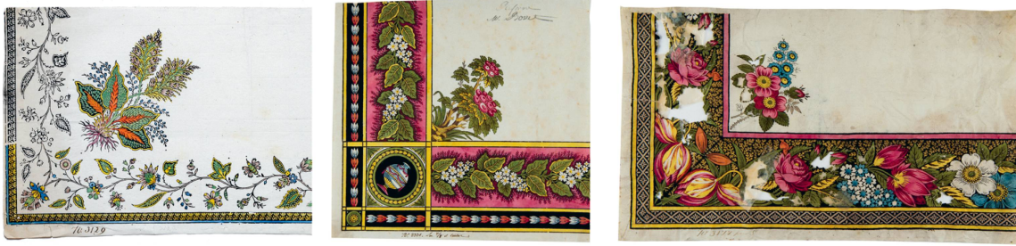
Dessins pour mouchoirs à bordures de fleur naturelles, gouache, Fabrique-Neuve de Cortaillod, entre 1780 et 1800.