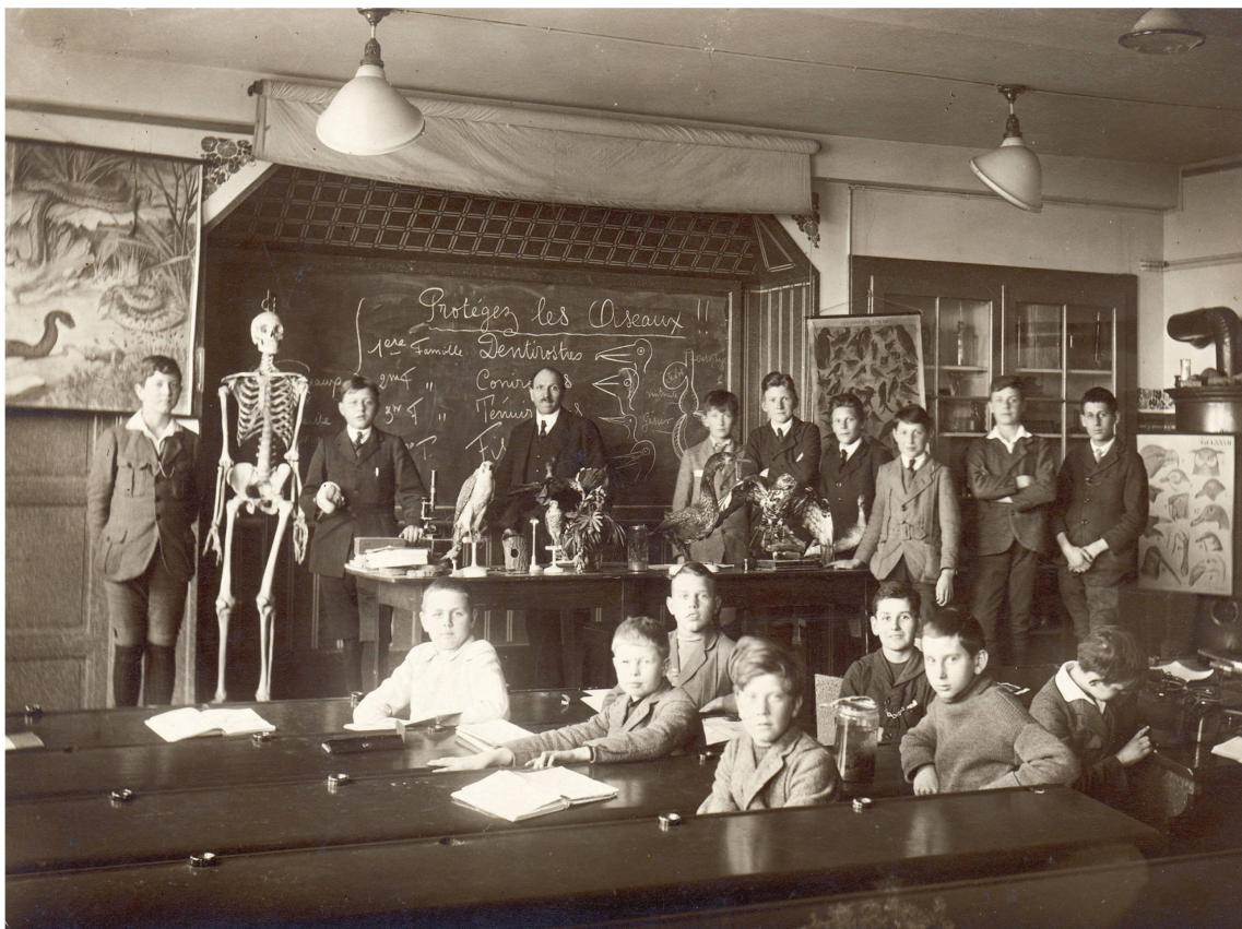
Photographie d'une classe de collège dans le canton de Vaud, 1919-1920. Les musées et les collections scolaires existent aussi dans les écoles, en particulier pour l'enseignement des sciences (squelettes, animaux empaillés, échantillons de matières premières et des productions artisanales ou industrielles).