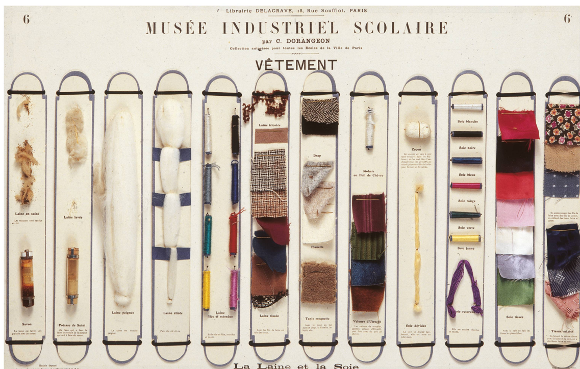
Tableau pédagogique Musée industriel scolaire de C. Dorangeon, édité par Delagrave, Paris, 1900. La caisse contenant la collection de 12 planches a été donnée en 1984 à l'Association du musée et de l'éducation par la Centrale de documentation scolaire.

constitue en 2000 la FVPS, désormais détentrice des collections, l'Association subsistant comme soutien. Les institutions patrimoniales sont officiellement représentées au conseil de la FVPS.