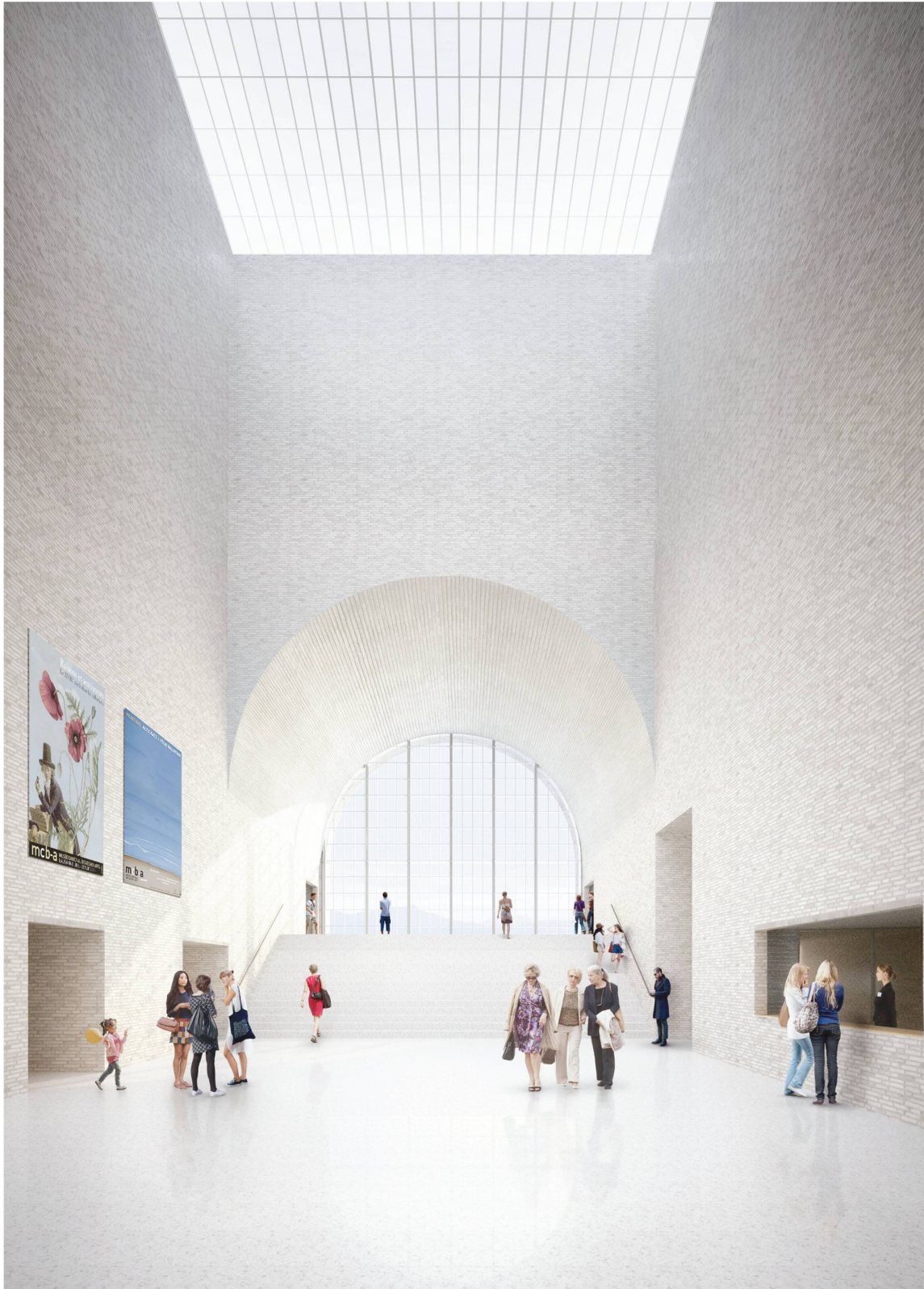
Le hall d'entrée du nouveau Musée cantonal des beaux-arts aux halles CFF.