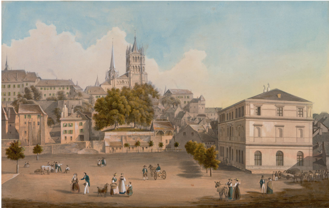
La place de la Riponne et le Musée Arlaud en 1845 par l'artiste Friedrich Martens.

florentine. À l'intérieur, son escalier central est monumentalisé par un effet de trompe-l'œil et son espace théâtralisé par un atrium avec bassin et deux étages de galeries périphériques. La référence florentine n'y est pas que stylistique: elle renvoie au berceau de l'humanisme renaissant.