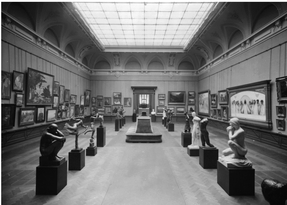
Salle de l'École moderne en 1938 dans le Palais de Rumine.

Saint-Légier, Ollon...) sont à nouveau minutieusement évalués, comparés, chiffrés. Et c'est finalement, en 2009, le vaste dépôt des locomotives en voie de désaffectation de la gare CFF, qui s'impose. Le changement de philosophie est radical. Là où le projet de Bellerive misait sur un nouvel atout culturel et paysager dans l'offre touristique lausannoise, celui de la gare propose la mutation d'une friche industrielle, le « raccommodage » d'un morceau de ville et la culture à portée de transports publics. La parcelle en question est immense. Les Lausannois eux-mêmes, qui n'y avaient pas accès jusque-là, n'en imaginaient pas l'ampleur : elle comporte une grande halle construite en 1911 classée au patrimoine et une annexe ajoutée en 1970. Au total : plus de 21 000 m 2 . Ce volume généreux qui dépasse les besoins du MCBA et sa bonne accessibilité donnent très vite des idées à quelques visionnaires : pourquoi ne pas valoriser l'ensemble du site en lui donnant une vocation commune et en y implantant un projet culturel d'envergure ? C'est alors que germe la belle et ambitieuse idée du pôle muséal à trois institutions cousines qui s'y trouveraient réunies dans un véritable quartier des arts : le MCBA, le Musée de l'Élysée (musée pour la photographie) et le Mudac (musée de design et d'arts contemporains).