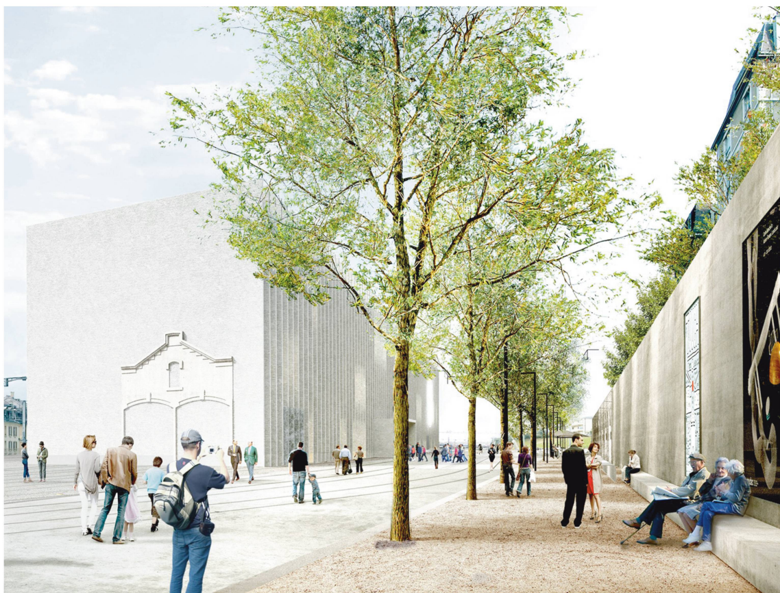
Le nouveau Musée cantonal des beaux-arts aux halles CFF de jour.

qui, lancée dans les années 1980-1990, envisageait de redynamiser le Palais de Rumine et l'ancien Musée Arlaud en y suscitant des approches thématiques communes à tous les musées impliqués. Exemple : dédier tous en même temps une exposition au lac Léman décliné sous des angles tant historique qu'artistique, biologique, limnologique ou environnemental... Un exercice extrêmement contraignant qui n'avait convaincu qu'une poignée d'enthousiastes !