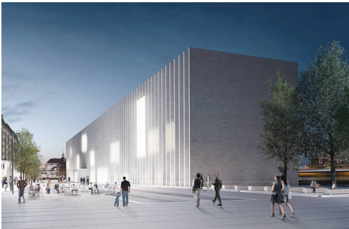
Le nouveau Musée cantonal des beaux-arts aux halles CFF de nuit.

Les gestations et accouchements muséaux ont manifestement toujours été difficiles à Lausanne.